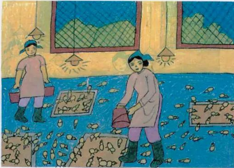
Trại nuôi gà Tranh sếp màu của học sinh