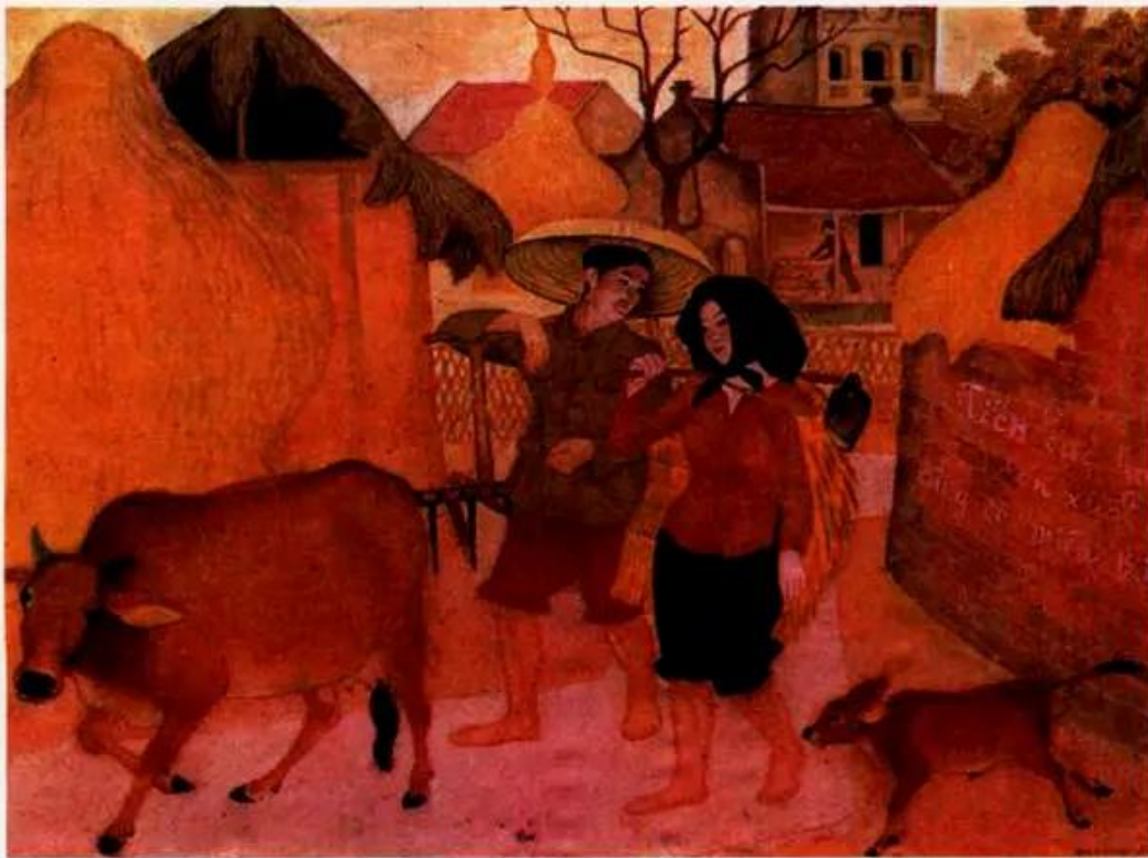
Về nông thôn sản xuất. Tranh lụa của Ngô Minh Cầu