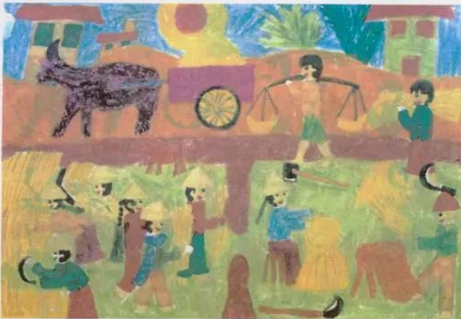
Thu hoạch lúa Tranh bút dạ của học sinh