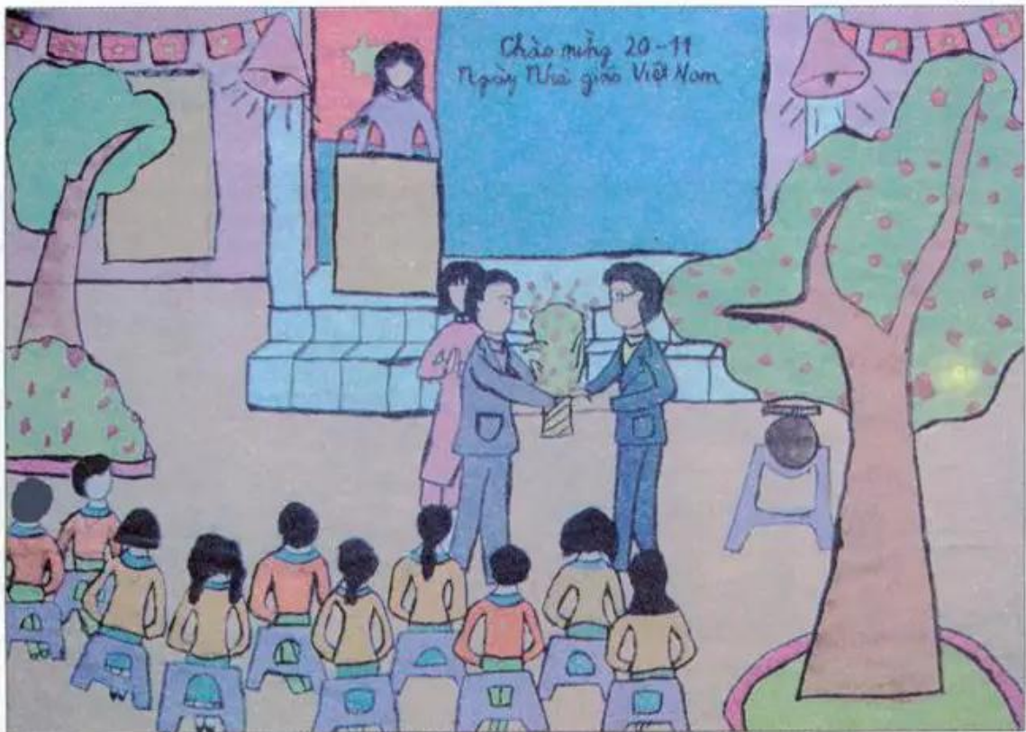
Chúc mừng cô giáo nhân ngày 20 – 11. Tranh màu bột của học sinh

Đề tài này rất phong phú, chọn nội dung mà mình yêu thích để vẽ.