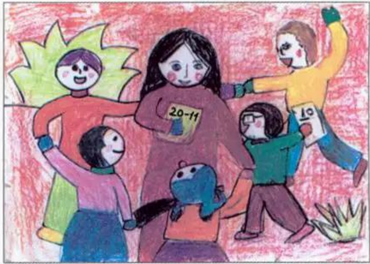
Chúc mừng cô giáo nhân ngày 20 - 11 Tranh sáp màu của học sinh