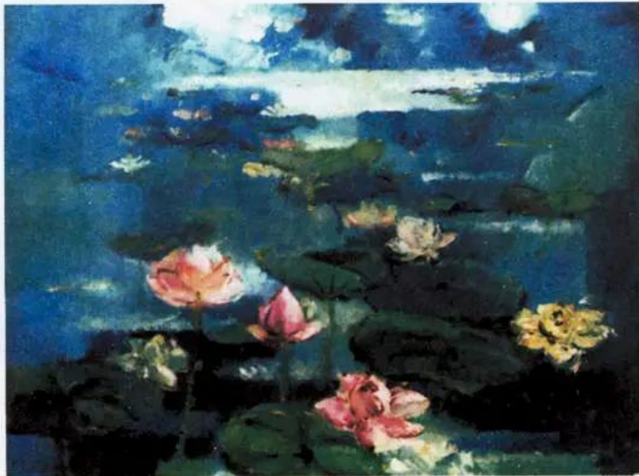
Mùa sen. Tranh sơn dầu của Đàm Luyện