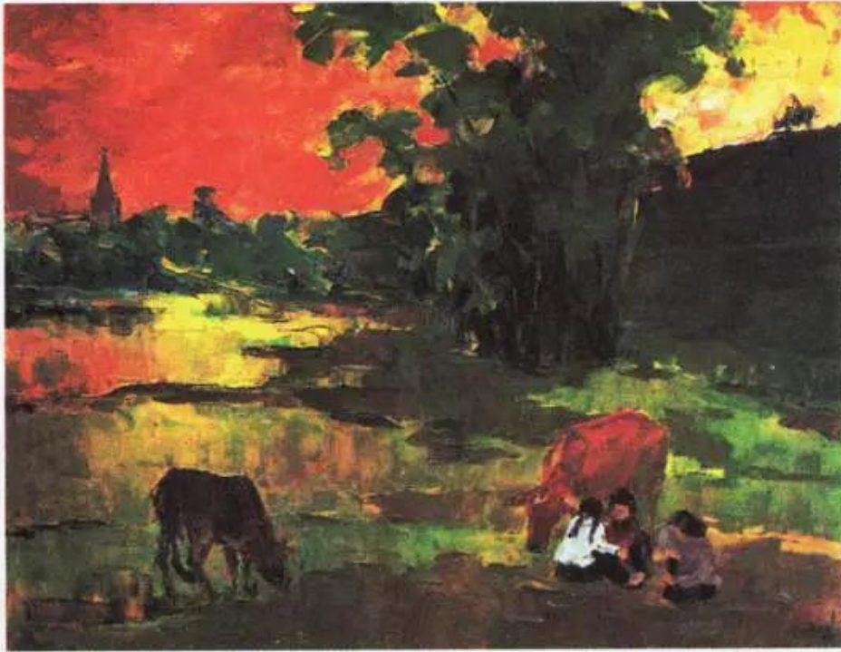
Chiều vàng. Tranh sơn dầu của Nguyễn Văn Nghinh