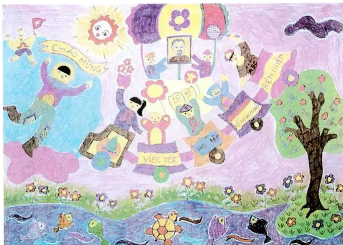
Chào mừng ngày sinh nhật Bác Hồ. Tranh sếp màu của học sinh