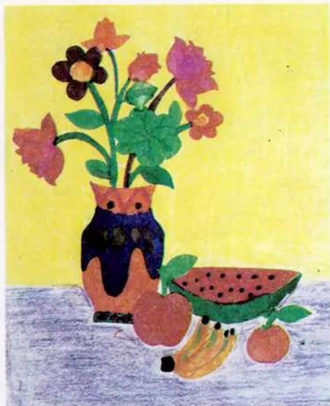
Lọ hoa và quả Tranh màu bột và sáp màu của học sinh