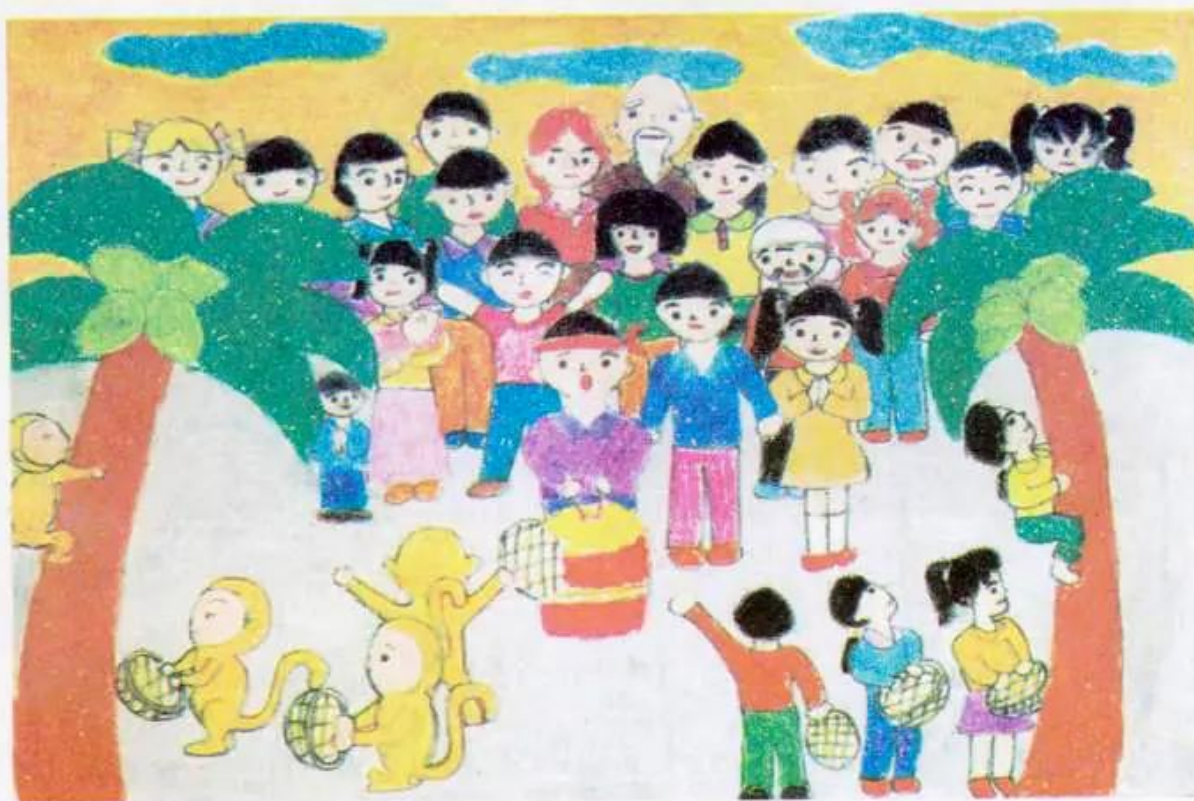
Hội thi hái dừa. Tranh sáp màu của học sinh