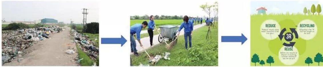
Hình 1. Phương pháp tiếp cận của bộ sách Khoa học tự nhiên 6

5. Dựa trên các cách tiếp cận: tiếp cận học tập qua trải nghiệm, thực tiễn; tiếp cận hoạt động – ý thức – nhân cách; và tiếp cận năng lực, dạy học tích hợp (Hình 1).