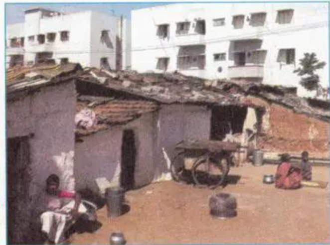
Hình 11.2 - Khu nhà ổ chuột ở Ấn Độ

Từ năm 1989 đến năm 2000, dân số đô thị ở đới nóng đã tăng lên gấp đôi. Với đà phát triển kinh tế và gia tăng dân số như hiện nay, trong vòng vài chục năm nữa tổng số dân đô thị của các nước thuộc đới nóng sẽ gấp hai lần tổng số dân đô thị của các nước thuộc đới ôn hoà.