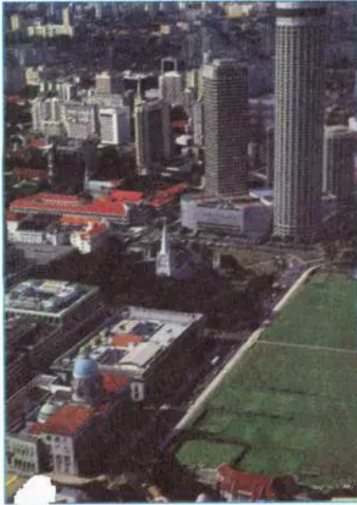
Hình 11.1 - Xin-ga-po, thành phố sạch nhất thế giới

- Quan sát hình 3.3, nêu tên các siêu đô thị có trên 8 triệu dân ở đới nóng.