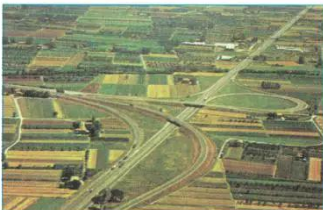
Hình 14.1 - Quang cảnh đồng ruộng ở I-ta-li-a

Tổ chức sản xuất nông nghiệp ở đới ôn hoà có hai hình thức chính : hộ gia đình và trang trại. Hai hình thức này tuy quy mô khác nhau nhưng đều có trình độ sản xuất tiên tiến và sử dụng nhiều dịch vụ nông nghiệp.