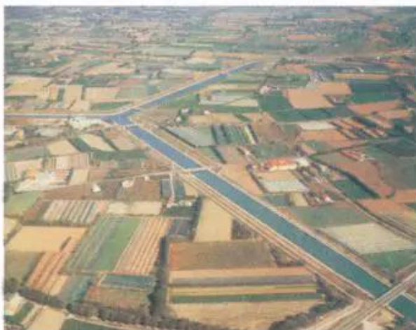
Hình 14.3 - Hệ thống kênh mương thủy lợi trên đồng ruộng

- Quan sát các ảnh dưới đây, nêu một số biện pháp khoa học - kĩ thuật được áp dụng trong sản xuất nông nghiệp ở đới ôn hoà.