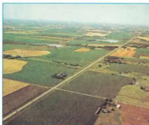
Hình 14.2 - Quang cảnh đồng ruộng ở Hoa Kỳ