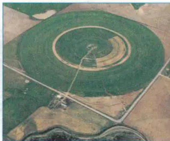
Hình 14.4 - Hệ thống tự động tưới xoay tròn