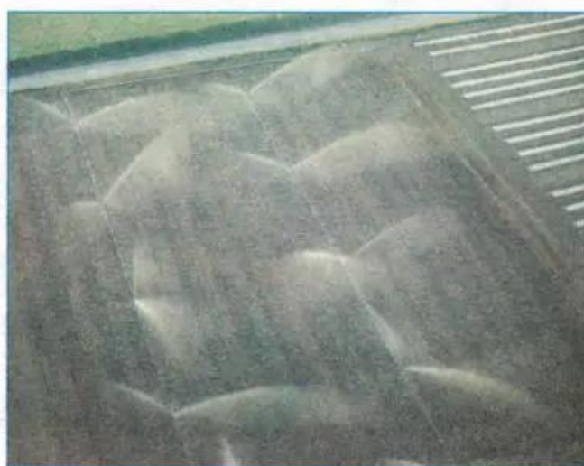
Hình 14.5 - Hệ thống tự động tưới phun sương