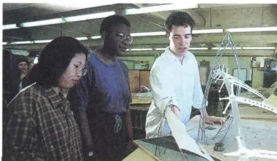
Hình 2.2 - Học sinh thuộc ba chủng tộc làm việc ở phòng thí nghiệm

Căn cứ vào hình thái bên ngoài của cơ thể (màu da, tóc, mắt, mũi...), các nhà khoa học đã chia dân cư trên thế giới thành ba chủng tộc chính : Môn-gô-lô-it (thường gọi là người da vàng), Nê-grô-it (người da đen) và Ơ-rô-pê-ô-it (người da trắng).