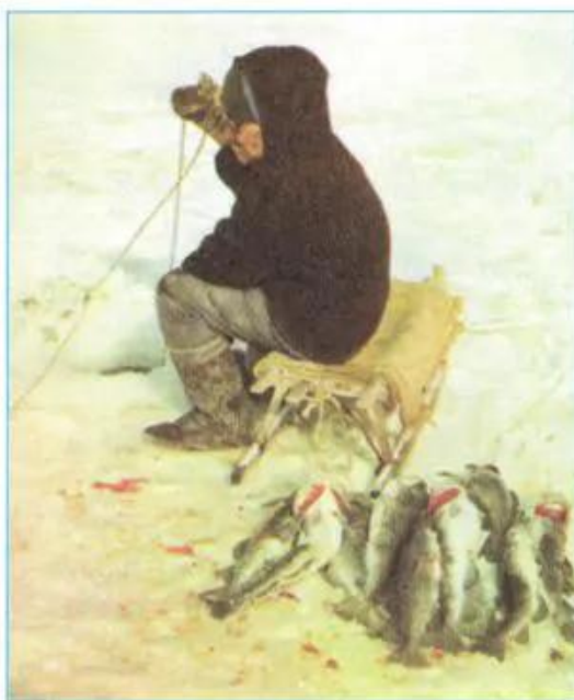
Hình 22.3 - Người I-nuc câu cá qua một hố băng