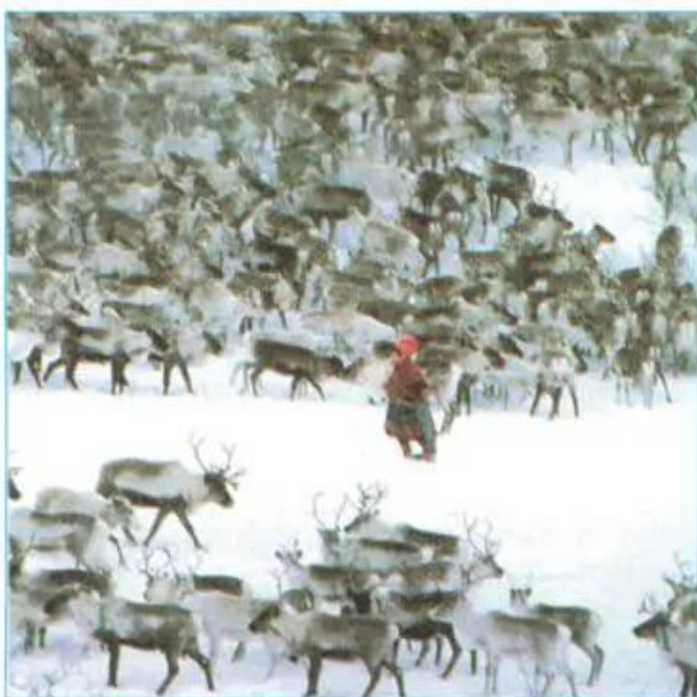
Hình 22.2 - Người La-pông ở Bắc Âu đang chăn dắt đàn tuần lộc

Khí hậu khắc nghiệt, lạnh lẽo khiến cho đới lạnh là nơi có rất ít dân. Dù đã thích nghi, các dân tộc sống lâu đời ở phương Bắc cũng chỉ sống được trong các dải nguyên ven biển phía bắc châu Âu, châu Á và Bắc Mỹ. Người La-pông ở Bắc Âu và người Chuk, người I-a-kut, người Xa-mô-y-et ở Bắc Á sống bằng nghề chăn nuôi tuần lộc và săn thú có lông quý. Người I-nuc ở Bắc Mỹ và ở đảo Gron-len sống bằng nghề đánh bắt cá hoặc săn bắn tuần lộc, hải cẩu, gấu trắng... để lấy mỡ, thịt và da. Họ di chuyển trên các xe trượt do chó kéo.