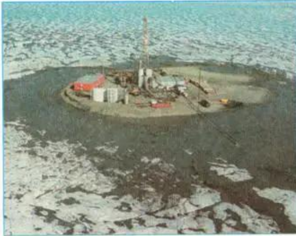
Hình 22.4 - Dàn khoan dầu mỏ trên biển băng phương Bắc