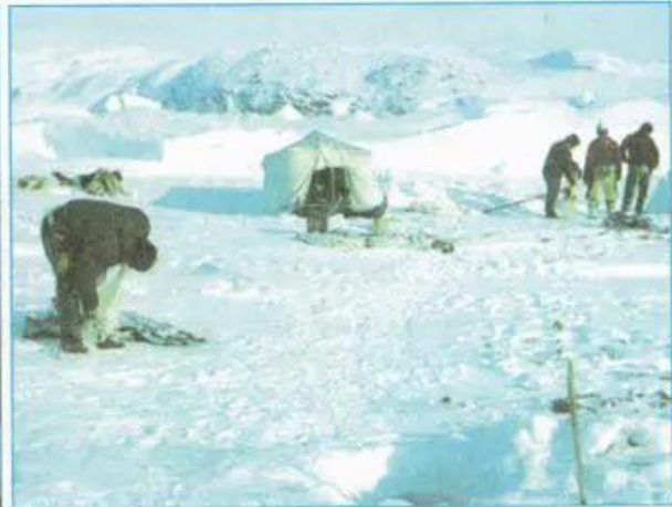
Hình 22.5 - Khoan thăm dò trên lục địa Nam Cực

Bảo vệ các loài động vật bị đe dọa tuyệt chủng và giải quyết sự thiếu nhân lực là hai vấn đề lớn đang đặt ra cho đới lạnh.