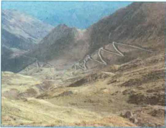
Hình 24.3 - Đường ô tô vượt qua một vùng núi hiểm trở của châu Á

- Tại sao phát triển giao thông và điện lực lại là những việc cần làm trước để biến đổi bộ mặt của các vùng núi ?