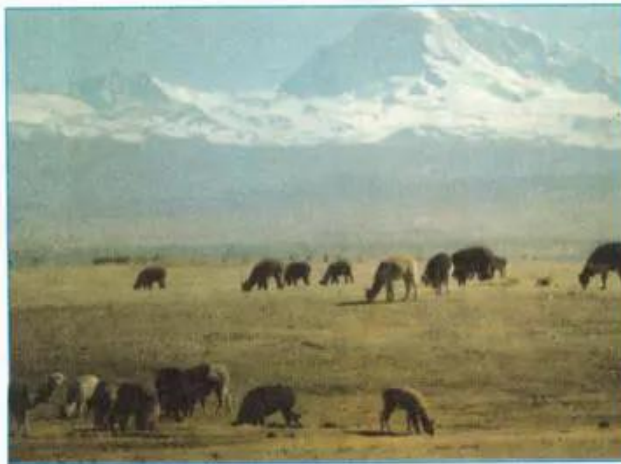
Hình 24.1 - Chăn nuôi lạc đà Lama trên một vùng núi ở Nam Mỹ

- Quan sát các ảnh dưới đây kết hợp với sự hiểu biết của bản thân, kể tên một số hoạt động kinh tế cổ truyền ở vùng núi.