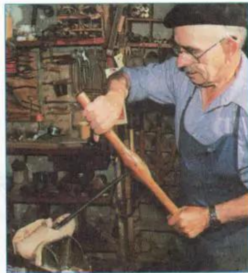
Hình 24.2 - Làm nghề thủ công trong một vùng núi ở châu Âu

Người dân ở các vùng núi trên thế giới thường sống dựa vào trồng trọt, chăn nuôi, khai thác và chế biến lâm sản. Hình thức trồng trọt và chăn nuôi cũng như các loại cây trồng và vật nuôi hết sức đa dạng, có sự khác nhau giữa các châu lục và các địa phương, phù hợp với môi trường tự nhiên của từng vùng núi. Ngoài chăn nuôi và trồng trọt, người dân vùng núi còn làm các nghề thủ công như chế biến thực phẩm, dệt vải hoặc dệt len, làm đồ mỹ nghệ... Nền kinh tế vùng núi phần lớn mang tính chất tự cung tự cấp, lưu truyền từ đời này sang đời khác. Một số sản phẩm thủ công của vùng núi được ưa chuộng ở cả trong nước và ngoài nước do chúng mang đậm sắc thái của từng dân tộc.