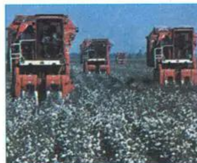
Hình 38.1 - Thu hoạch bông

Hoa Kỳ và Ca-na-đa là những nước xuất khẩu nông sản hàng đầu của thế giới. Mê-hi-cô có trình độ phát triển thấp hơn, nhưng đây cũng là một trong những nước đi đầu thực hiện cuộc Cách mạng xanh, đảm bảo được lương thực trong nước.