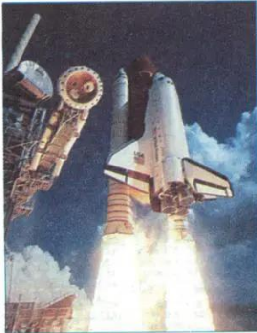
Hình 39.2 - Tàu con thoi Cha-len-giơ

Vào cuối thế kỉ XIX, Hoa Kỳ phát triển mạnh các ngành truyền thống như luyện kim, chế tạo máy công cụ, hoá chất, dệt, thực phẩm... ; tập trung ở phía nam Hồ Lớn và vùng Đông Bắc ven Đại Tây Dương.