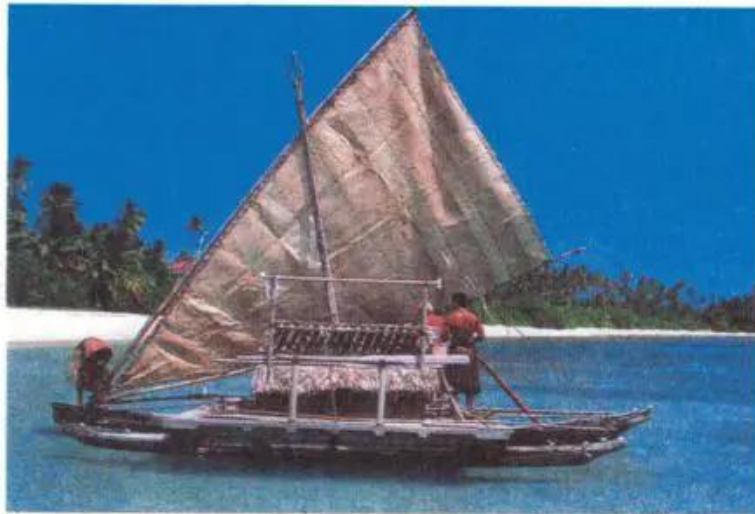
Hình 49.2 - Người Pô-li-nê-diêng chuẩn bị ra khơi

Người bản địa chiếm khoảng 20% dân số, bao gồm người Ô-xtrây-lô-it sống ở Ô-xtrây-li-a và các đảo chung quanh, người Mê-la-nê-diêng sống trên các đảo Tây Thái Bình Dương và người Pô-li-nê-diêng sống trên các đảo Đông Thái Bình Dương.