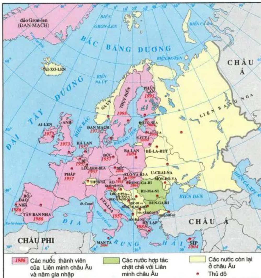
Hình 60.1 - Quá trình mở rộng Liên minh châu Âu đến năm 2004

Liên minh châu Âu được mở rộng từng bước, qua nhiều giai đoạn. Năm 2001, Liên minh châu Âu có diện tích 3.243.600 km 2 với dân số 378 triệu người. Năm 2004, Liên minh châu Âu kết nạp thêm 10 thành viên.