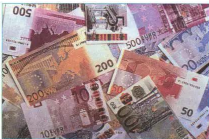
Hình 60.2 - Đồng tiền chung châu Âu

Các nước trong Liên minh châu Âu chú trọng bảo vệ tính đa dạng về văn hoá và ngôn ngữ, tổ chức và tài trợ việc học ngoại ngữ, trao đổi sinh viên, tổ chức đào tạo nghề nghiệp cho giới trẻ và những người thất nghiệp.