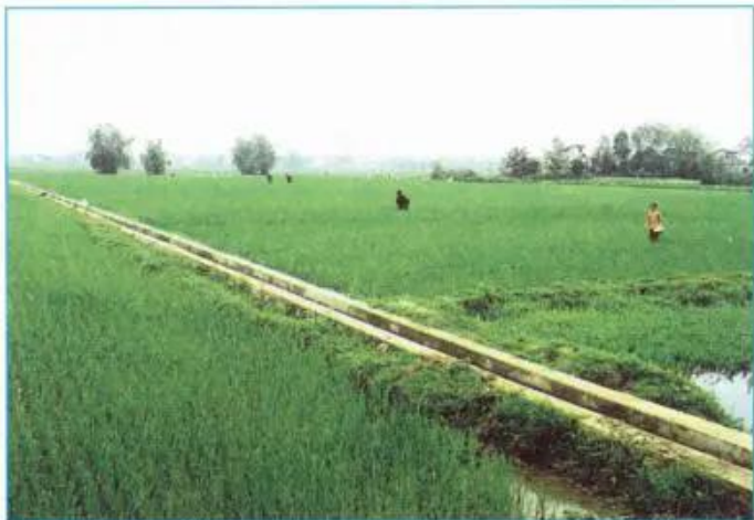
Hình 8.3 - Cảnh đồng trồng lúa nước

Do áp dụng những tiến bộ về khoa học - kĩ thuật và có chính sách nông nghiệp đúng đắn, một số nước trước đây thiếu lương thực (như Việt Nam, Thái Lan) nay đã trở thành những nước xuất khẩu gạo. Nhờ cuộc Cách mạng xanh mà ngay một nước đông dân như Ấn Độ cũng đã giải quyết được vấn đề lương thực.