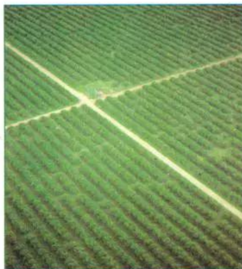
Hình 8.5 - Đồn điền trồng hồ tiêu ở Nam Mĩ

Hình thức canh tác này tạo ra khối lượng nông sản hàng hoá lớn và có giá trị cao, tuy nhiên phải bám sát nhu cầu của thị trường.