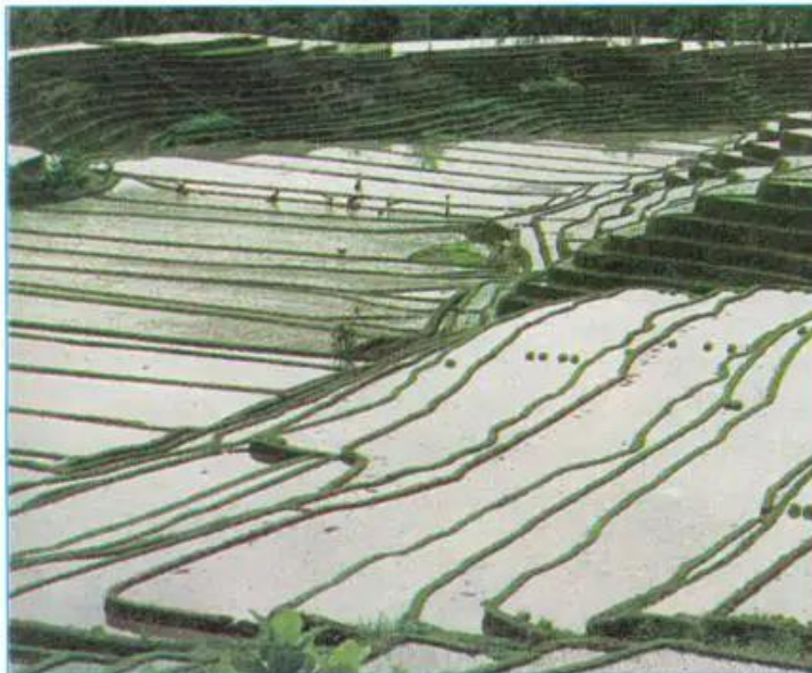
Hình 8.6 - Trồng lúa nước trên ruộng bậc thang ở vùng đồi núi châu Á

3. Quan sát các hình 8.6 và 8.7, cho biết : Làm ruộng bậc thang và canh tác theo đường đồng mức ở vùng đồi núi có ý nghĩa như thế nào đối với môi trường ?