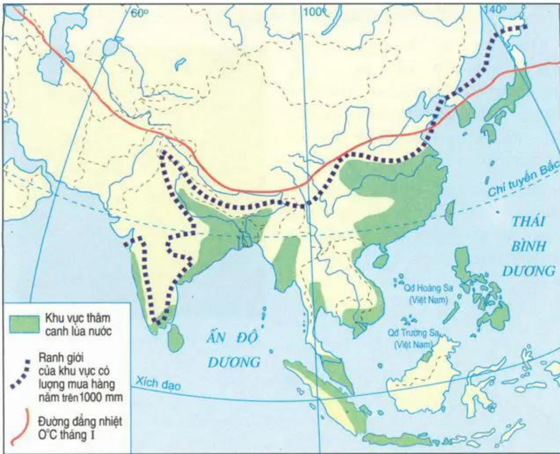
Hình 8.4 - Lược đồ những khu vực thâm canh lúa nước ở châu Á

Thâm canh lúa cho phép tăng vụ, tăng năng suất, nhờ đó sản lượng cũng tăng lên. Chăn nuôi gia súc, gia cầm cũng có điều kiện phát triển. Tuy nhiên, vì dân số đông và thời tiết thất thường nên một số nước vẫn lâm vào tình trạng thiếu lương thực.