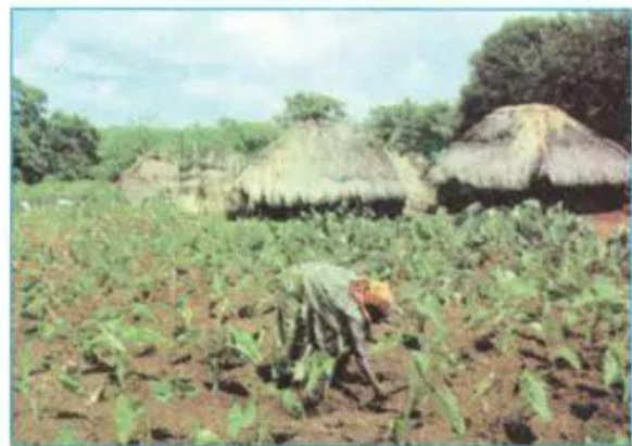
Hình 8.2 - Rẫy khoai sọ trên xavan châu Phi