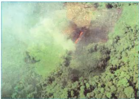
Hình 8.1 - Đốt rừng làm nương rẫy

- Qua các ảnh dưới đây, nêu một số biểu hiện cho thấy sự lạc hậu của hình thức sản xuất nương rẫy.