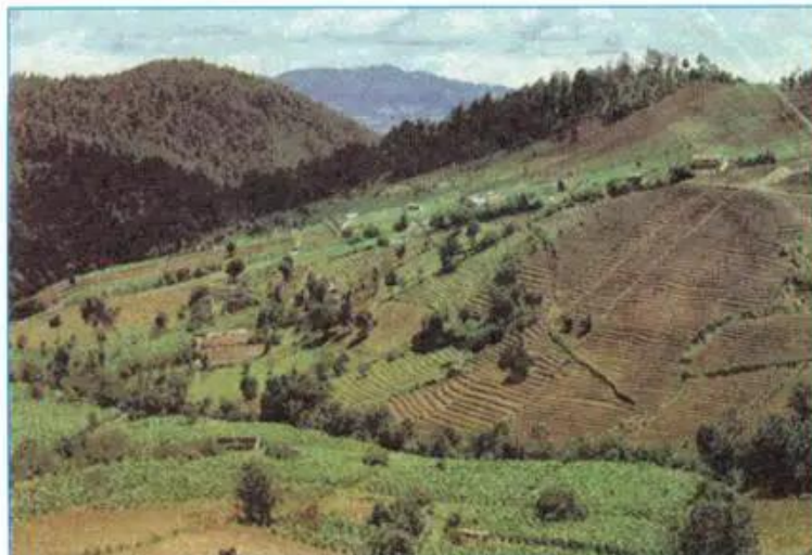
Hình 8.7 - Trồng ngô (bắp) và khoai tây theo đường đồng mức ở vùng đồi núi Nam Mĩ