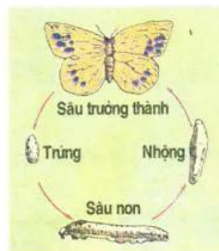
Hình 18. Biến thái hoàn toàn