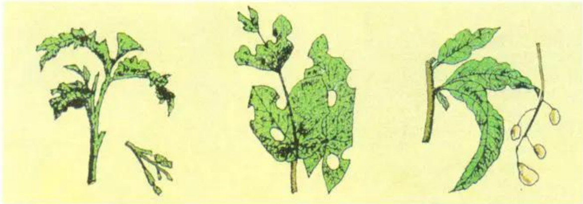
a) Cành bị gãy

Khi cây bị sâu, bệnh phá hại, thường có những biến đổi về màu sắc, hình thái, cấu tạo .... (h.20).