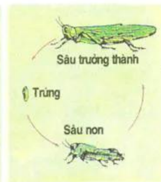
Hình 19. Biến thái không hoàn toàn