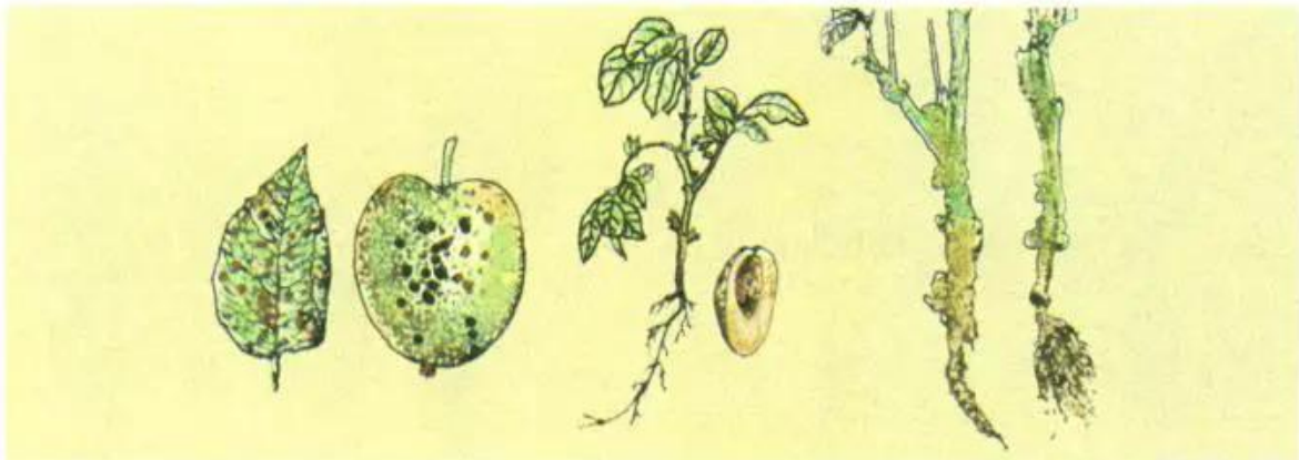
d) Lá, quả bị đốm đen, nâu