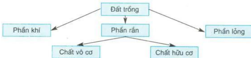
Sơ đồ 1. Thành phần của đất trồng

Thành phần của đất trồng được trình bày ở sơ đồ 1 dưới đây :