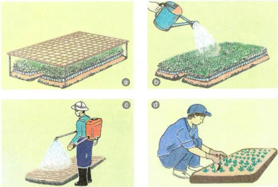
Hình 38. Chăm sóc vườn gieo ươm cây rừng