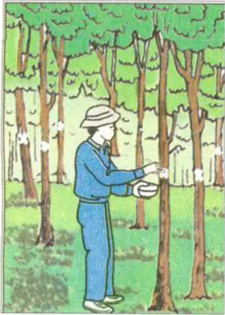
Hình 45. Chọn cây khai thác X : Cây được chọn để chặt hạ