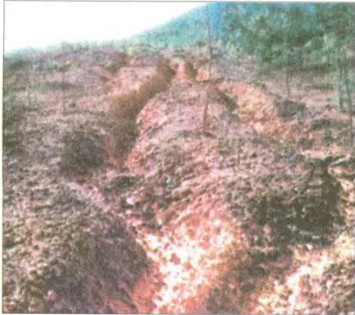
Hình 46. Đất bị xói mòn thành rãnh sâu do rừng bị khai thác trắng