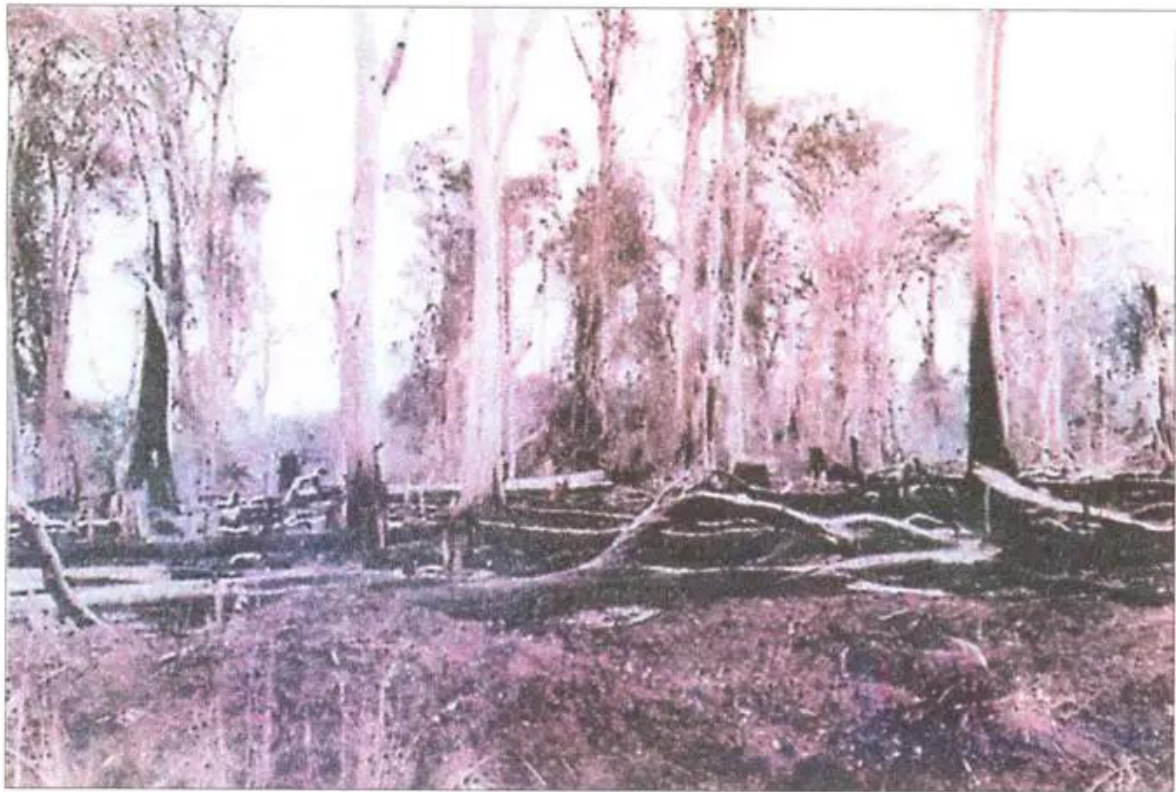
Hình 49. Rừng bị tàn phá