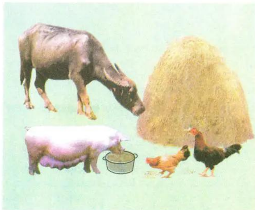
Hình 63. Thức ăn vật nuôi

Như vậy vật nuôi chỉ ăn được những loại thức ăn nào phù hợp với đặc điểm sinh lí tiêu hóa của chúng.