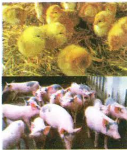
Hình 72. Một số đặc điểm phát triển cơ thể của vật nuôi non