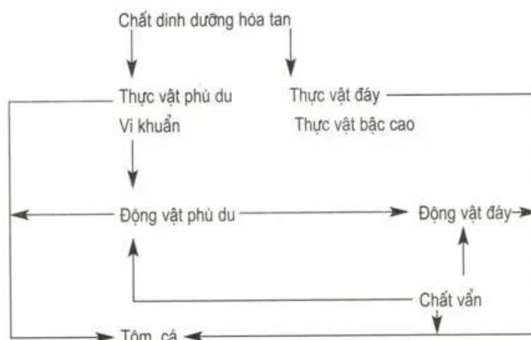
Sơ đồ 16. Quan hệ về thức ăn của tôm, cá

Ví dụ : Mối quan hệ về thức ăn của tôm, cá có thể tóm tắt như sơ đồ 16.