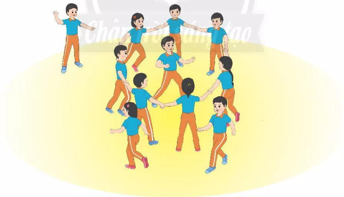
Hình 3. Trò chơi Giăng lưới bắt cá

Cách thực hiện: Người chơi chia thành hai nhóm với số lượng bằng nhau. Một nhóm nắm tay nhau để chuẩn bị làm lưới vây bắt "cá". Nhóm còn lại làm "cá" chạy tự do trên sân. Khi nghe hiệu lệnh (tiếng còi hoặc tiếng vỗ tay), những bạn làm lưới sẽ tạo thành vòng tròn và tìm mọi cách dồn "cá" vào trong để bắt. "Đàn cá" di chuyển nhanh, khéo léo trong khu vực sân chơi để không bị bắt vào lưới. Những con "cá" bị vây trong lưới sẽ bị loại trong lượt chơi tiếp theo. Nhóm làm lưới thực hiện vây bắt "cá" trong ba lượt. Sau đó đổi vai trò của hai nhóm và thực hiện tương tự. Nhóm nào bắt được nhiều "cá" hơn thắng cuộc.