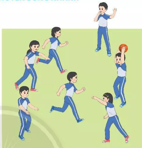
Hình 1. Trò chơi Chạy và chuyền bóng nhanh

Cách thực hiện: Người chơi chia thành các nhóm. Cả nhóm điểm số từ 1 đến hết, mỗi nhóm có một quả bóng. Khi bắt đầu, bạn số 1 ném bóng cho bạn số 2 bắt, sau đó bạn số 2 ném cho bạn số 3,... Các bạn thực hiện ném và bắt bóng trong khu vực quy định. Mỗi bạn thực hiện từ 2 – 3 lần ném và bắt bóng. Nhóm nào không làm rơi bóng trong suốt lượt chơi là chiến thắng.