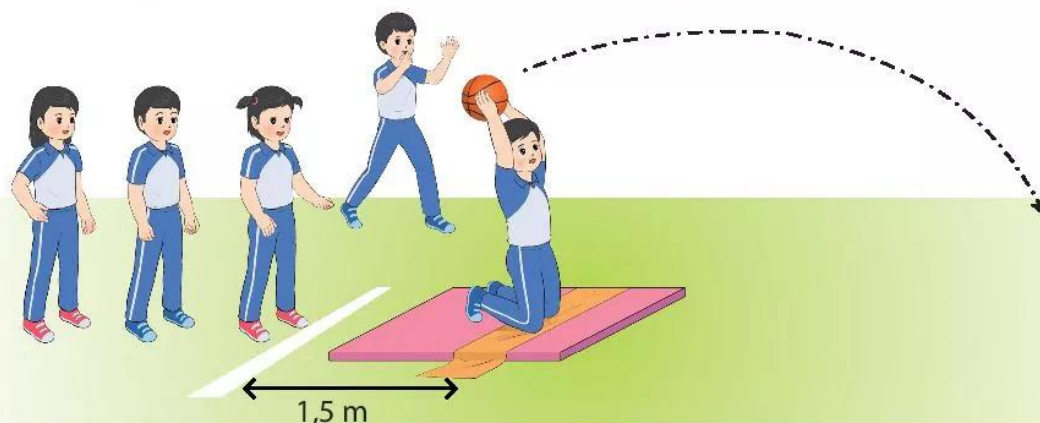
Hình 2. Trò chơi Quỳ ném

Cách thực hiện: Người chơi chia thành các nhóm. Lần lượt mỗi bạn thực hiện quỳ gối lên miếng đệm (hoặc bề mặt mềm, êm) và ném bóng về trước. Ghi nhận lại thành tích của các lần ném. Điểm của nhóm bằng tổng điểm của các bạn trong nhóm. Nhóm nào có tổng thành tích ném cao nhất là chiến thắng.