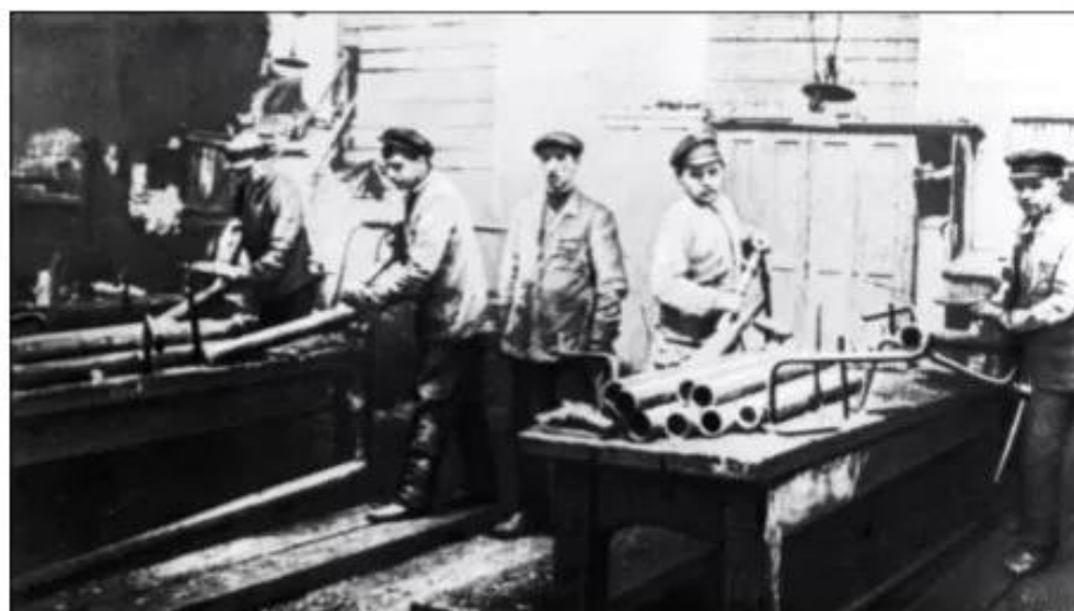
Hình 26. Công nhân làm việc trong xí nghiệp ở Nga thời kì Chính sách kinh tế mới

Chính sách kinh tế mới là sự chuyển đổi kịp thời từ nền kinh tế do Nhà nước nắm độc quyền về mọi mặt sang nền kinh tế nhiều thành phần, nhưng vẫn đặt dưới sự kiểm soát của Nhà nước. Với chính sách này, nhân dân Xô viết đã vượt qua được những khó khăn to lớn, phấn khởi sản xuất và hoàn thành công cuộc khôi phục kinh tế. Cho đến nay, Chính sách kinh tế mới còn để lại nhiều kinh nghiệm đối với công cuộc xây dựng chủ nghĩa xã hội ở một số nước trên thế giới.