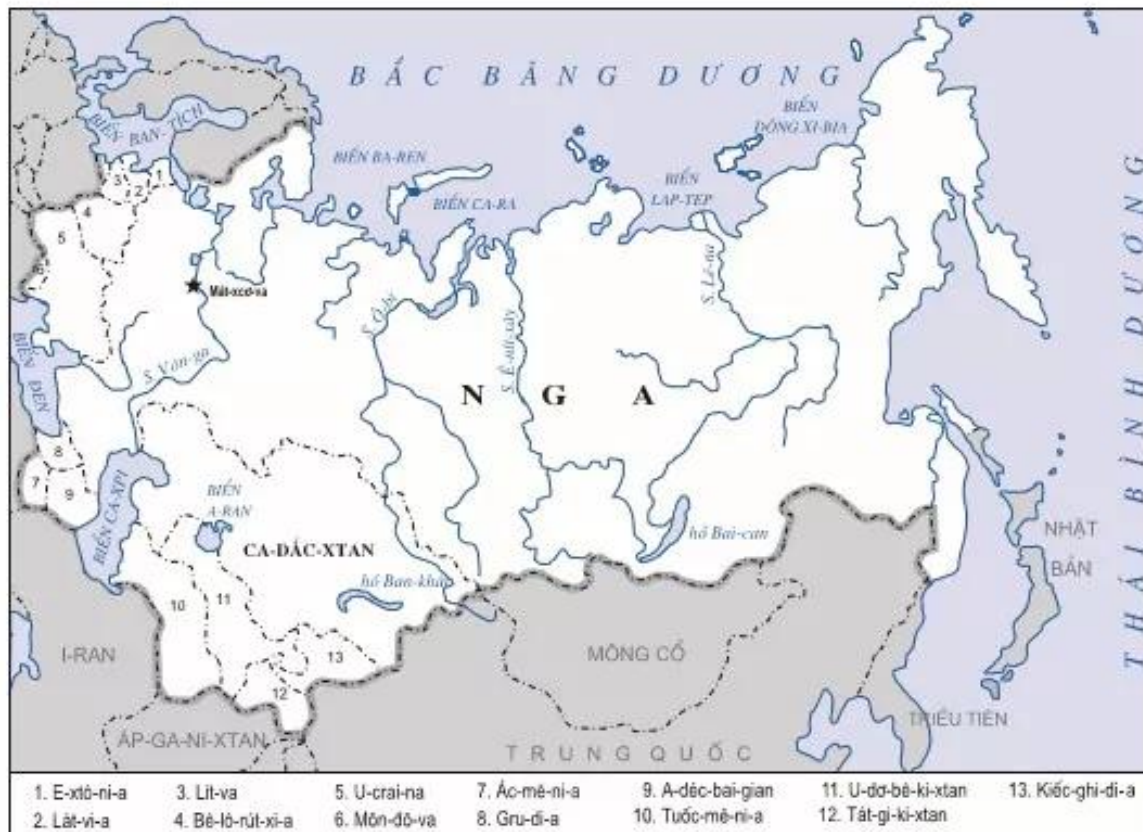
Hình 27. Lược đồ Liên Xô năm 1940