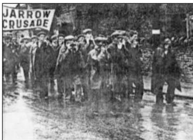
Hình 30. Một cuộc di bộ của công nhân Anh từ Gia-râu đến Luân Đôn để đòi việc làm

mình. Trong khi các nước Mĩ, Anh, Pháp tiến hành những cải cách kinh tế - xã hội để khắc phục hậu quả của cuộc khủng hoảng và đổi mới quá trình quản lí, tổ chức sản xuất thì các nước Đức, I-ta-li-a, Nhật Bản lại tìm kiếm lối thoát bằng những hình thức thống trị mới. Đó là việc thiết lập các chế độ độc tài phát xít - nền chuyên chính khủng bố công khai của những thế lực phản động nhất, hiếu chiến nhất.