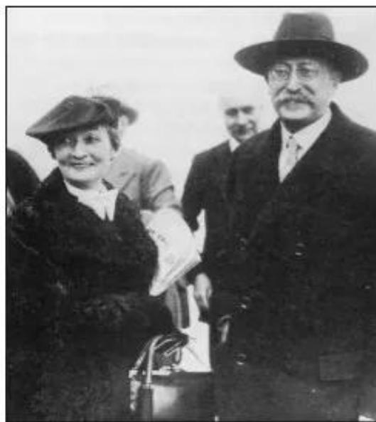
Hình 31. Lê-ông Bơ-lum (bên phải) - người đứng đầu Chính phủ Mặt trận Nhân dân Pháp năm 1936

Ở Tây Ban Nha, Mặt trận Nhân dân cũng giành được thắng lợi trong cuộc tổng tuyển cử vào tháng 2 - 1936 và Chính phủ Mặt trận Nhân dân được thành lập. Tuy nhiên, trước ảnh hưởng ngày càng lớn của những người cộng sản trong Chính phủ và các biện pháp cải cách tiến bộ, các nước đế quốc đã tăng cường giúp đỡ thế lực phát xít do Phran-cô cầm đầu gây nội chiến nhằm thủ tiêu nền cộng hoà.