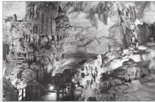
2 Động Thiên Đường, tỉnh Quảng Bình