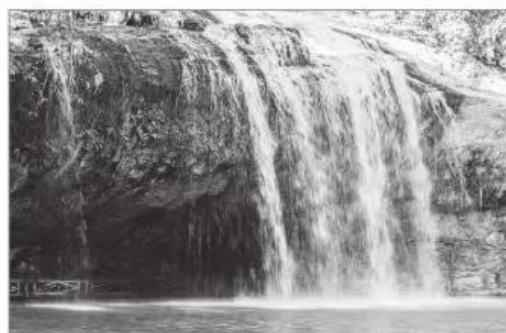
6 Thác Pơ-ren, tỉnh Lâm Đồng