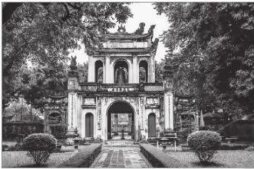
1 Văn Miếu – Quốc Tử Giám, Thủ đô Hà Nội

Câu 1. Quan sát các hình rồi hoàn thành bảng sau.