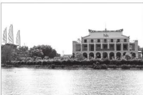
5 Bến Nhà Rồng, Thành phố Hồ Chí Minh