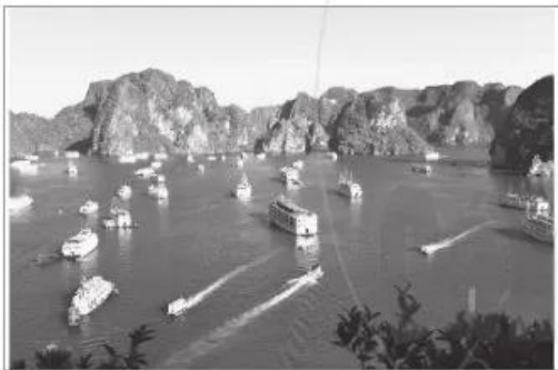
3 Vịnh Hạ Long, tỉnh Quảng Ninh