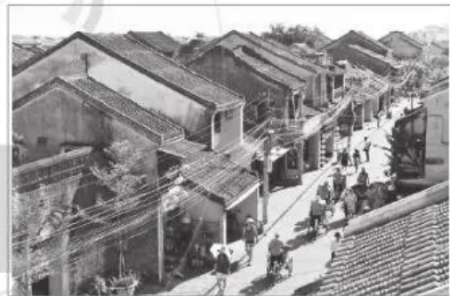
4 Phố cổ Hội An, tỉnh Quảng Nam