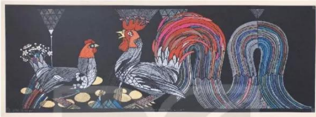
Gà hoàng tộc, tranh khắc gỗ, Vũ Đình Tuấn, 2019, 39 x 109 cm