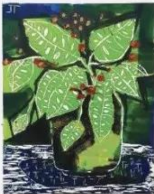
Tinh vật, sản phẩm mỹ thuật từ in khắc gỗ, Trúc Linh