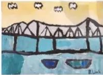
Cầu Long Biên, sản phẩm mỹ thuật từ màu goats, Bảo Linh