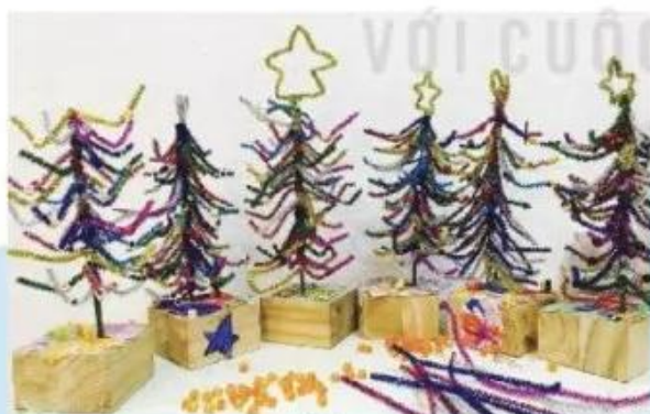
Sản phẩm trang trí cây thông Nô-en