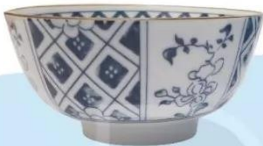
Bát gốm