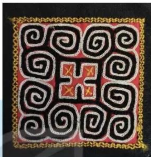
Vải thổ cẩm