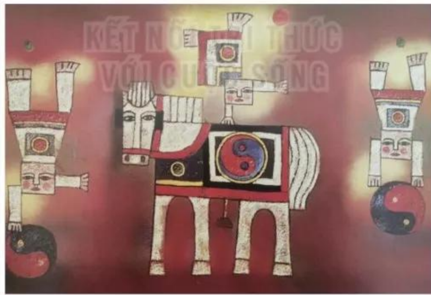
Làm xiếc, tranh sơn dầu, Bửu Chí, 1998, 120 x 200 cm