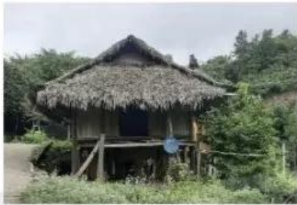
Nhà sàn, tỉnh Hoà Bình