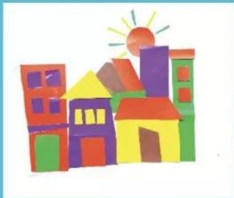
Phong cảnh, sản phẩm mỹ thuật từ giấy, Đức Sĩ