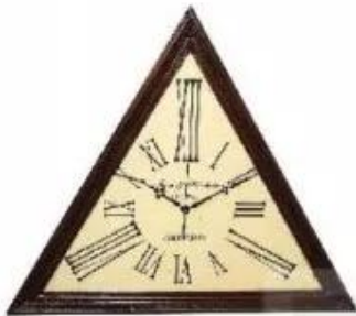
Đồng hồ