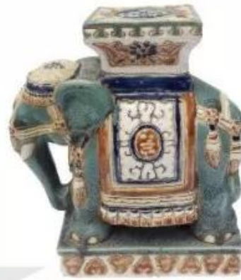
Ghè voi