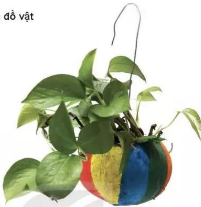
Chậu cây