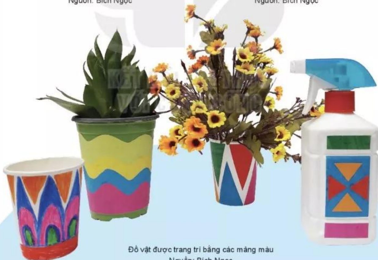
Đồ vật được trang trí bằng các mảng màu