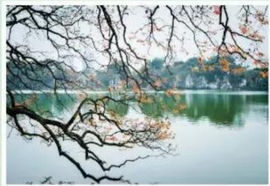
Hồ Gươm, Hà Nội