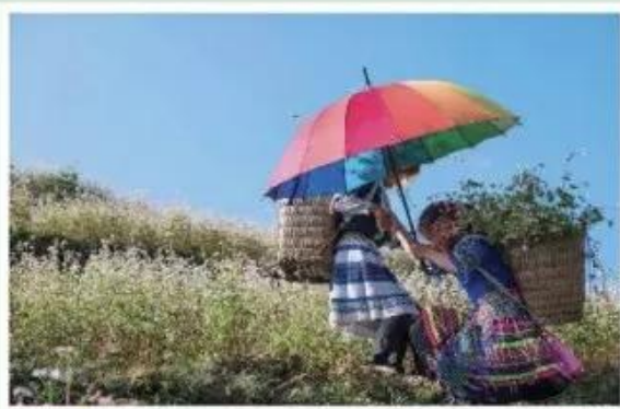
Giúp bạn