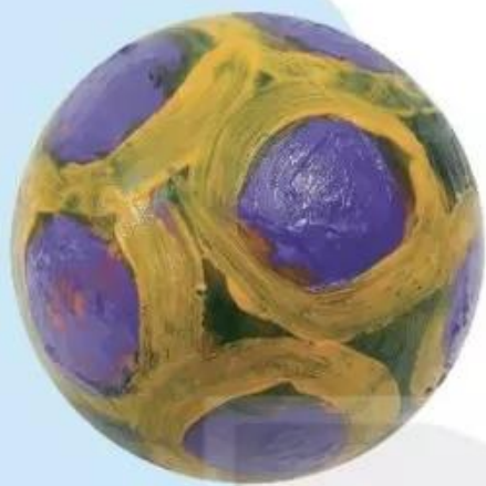
Quả bóng