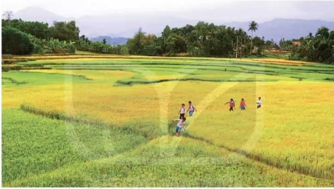
Trên cánh đồng vàng