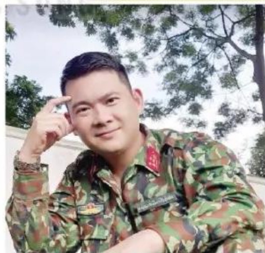
Anh bộ đội đặc công