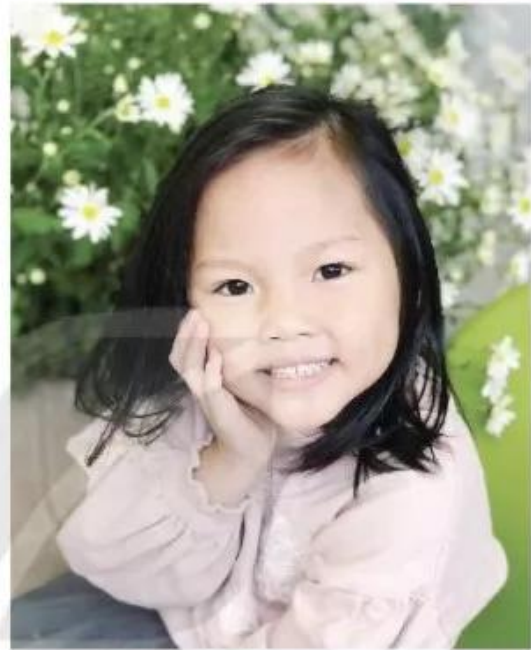
Nụ cười