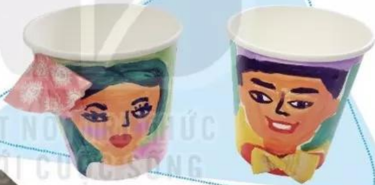
Chân dung vẽ màu a-cờ-ry-lic trên cốc giấy, Hồng Hà