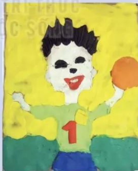
Thể hiện chân dung bằng cách miết đất nặn trên tấm bìa