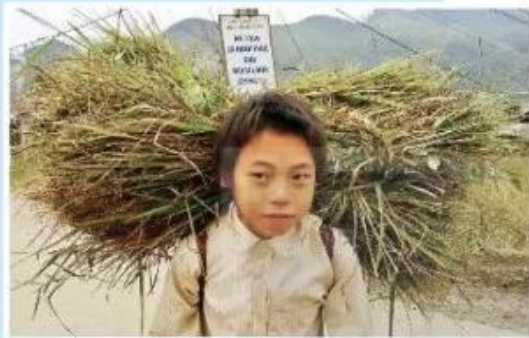
Em bé ở Lũng Cú