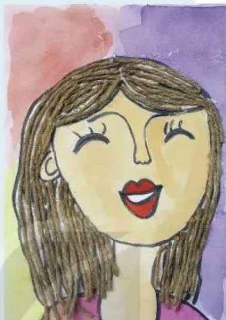
Thể hiện chân dung bằng màu nước kết hợp với sợi dây đay