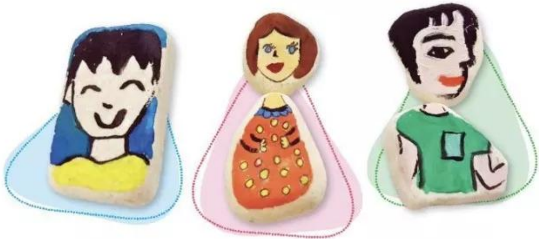
Chân dung vẽ màu goát trên sỏi, Tuấn Anh