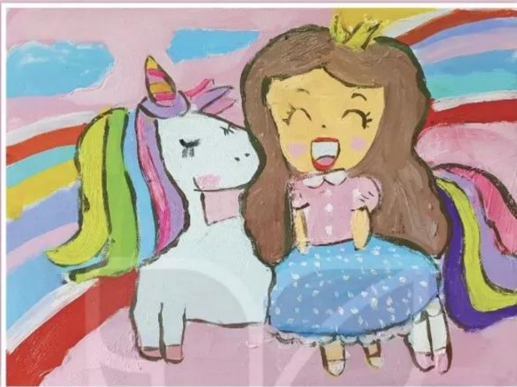
Em bé cầu vồng, sản phẩm mỹ thuật từ màu a-cờ-ry-lic, Anh Thu