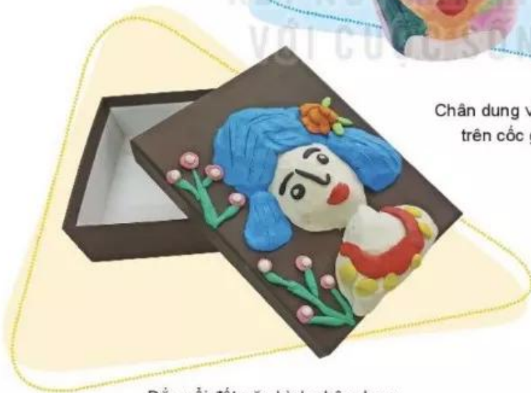
Đắp nổi đất nặn hình chân dung trên hộp đựng quà, Thanh Bình