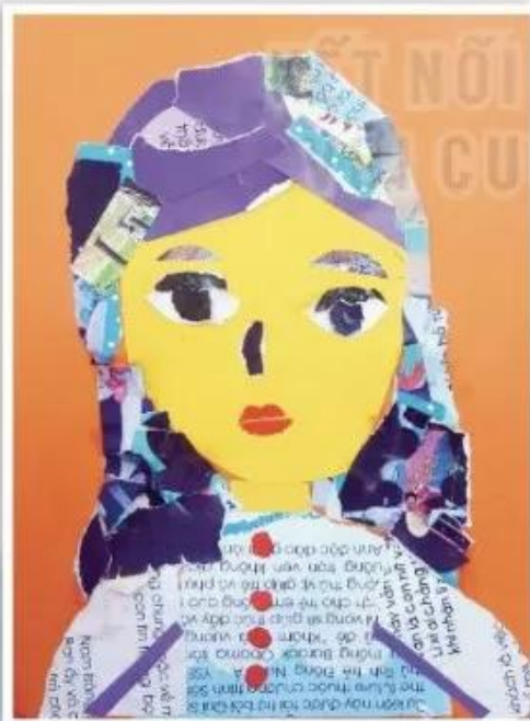
Chị gái em, sản phẩm mỹ thuật từ giấy màu và giấy báo, Bảo Hân