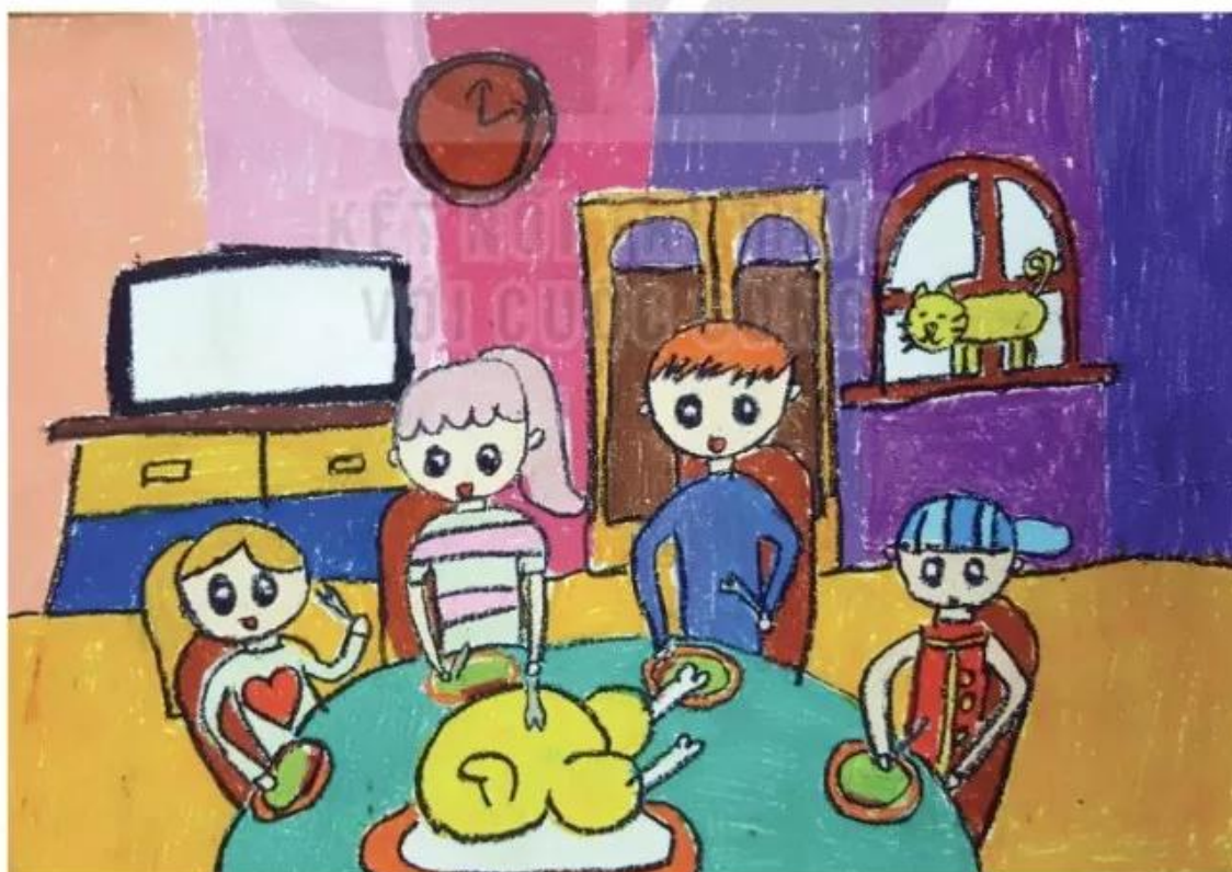
Hôm nay có món gà quay, sản phẩm mỹ thuật từ sáp màu dầu, Anh Thư