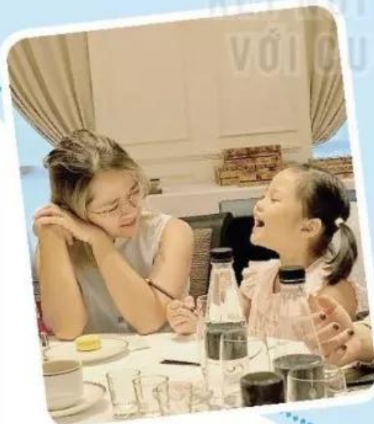
Trò chuyện trong bữa ăn