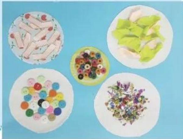
Gợi ý cách tạo sản phẩm từ vật liệu sẵn có