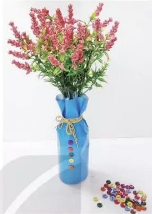
Sản phẩm mỹ thuật từ vỏ chai nước và trang trí bằng giấy màu, khuy, các sợi dây, Thanh Trang