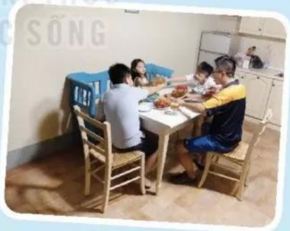
Bữa tối vui vẻ