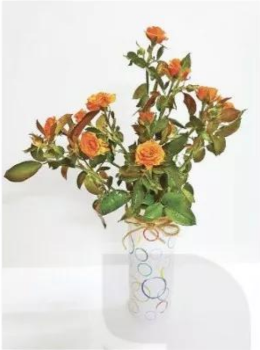
Sản phẩm mỹ thuật từ vỏ chai nước và trang trí bằng giấy trắng in màu nắp chai, dây buộc, Nam Phong