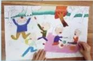
Gợi ý cách vẽ tranh