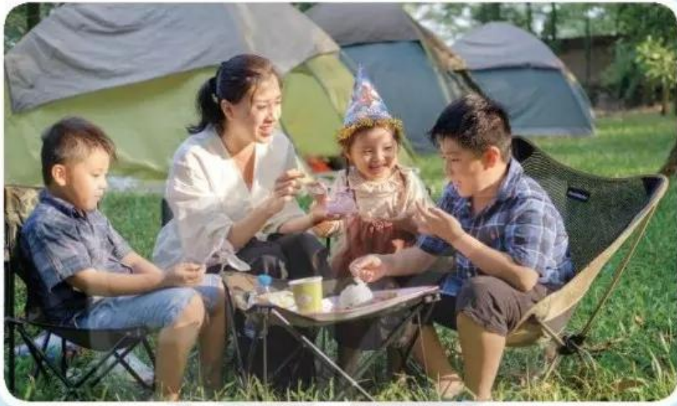
Bữa ăn ngoài trời