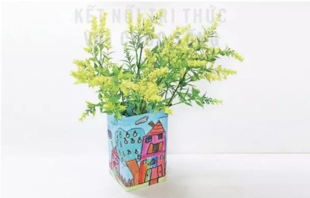
Sản phẩm mỹ thuật từ giấy bìa và trang trí bằng màu dạ, Bích Hạnh