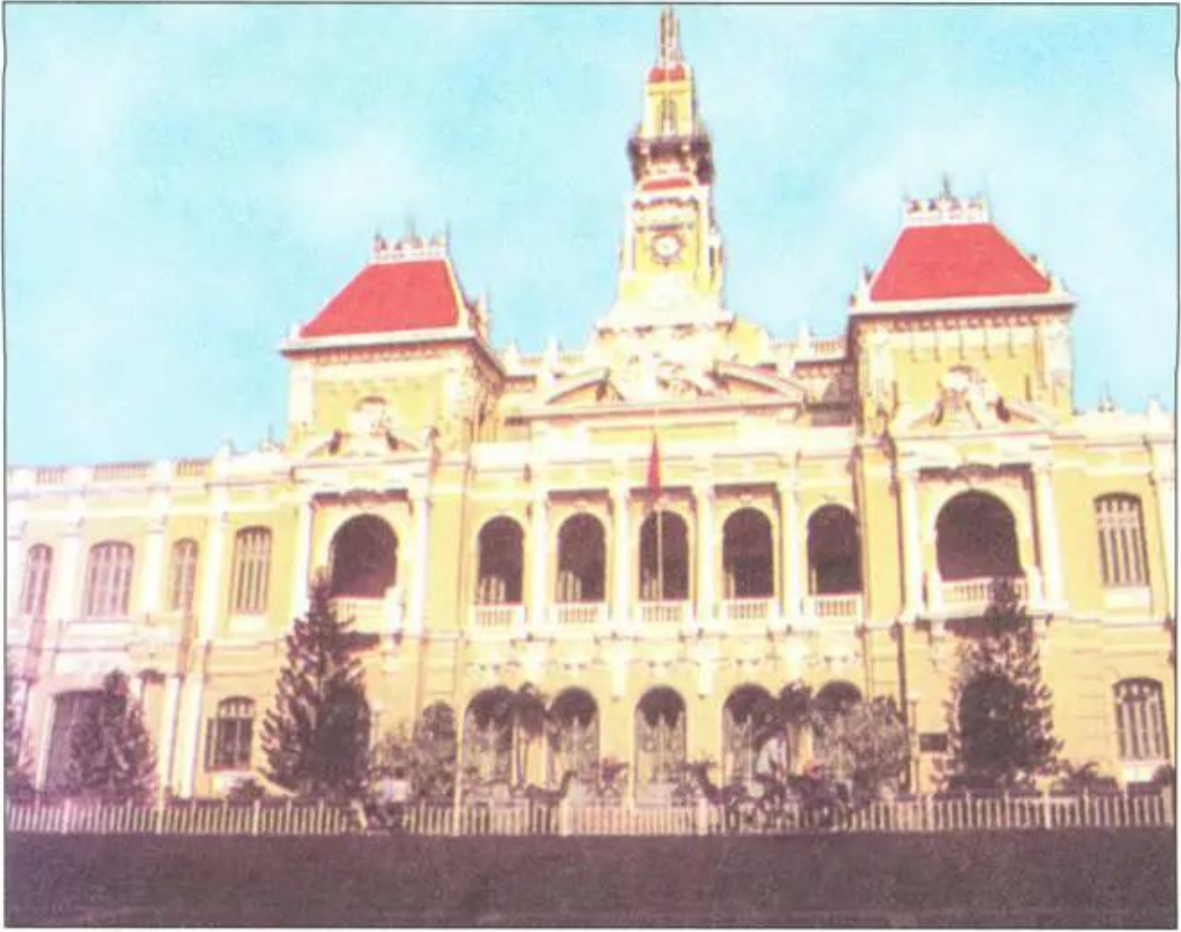
① Trụ sở Ủy ban nhân dân Thành phố Hồ Chí Minh