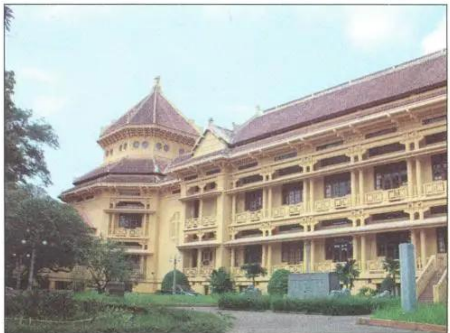
② Viện Bảo tàng Lịch sử Việt Nam ở Hà Nội