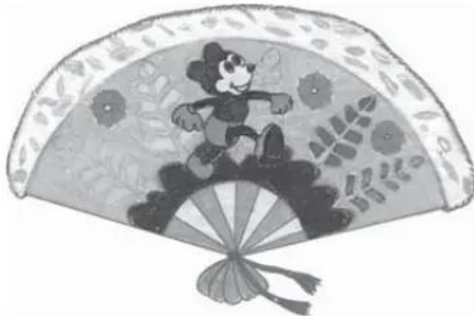
Trang trí quạt giấy. Bài vẽ của HS