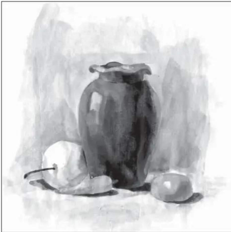
Lọ và quả. Bài tham khảo