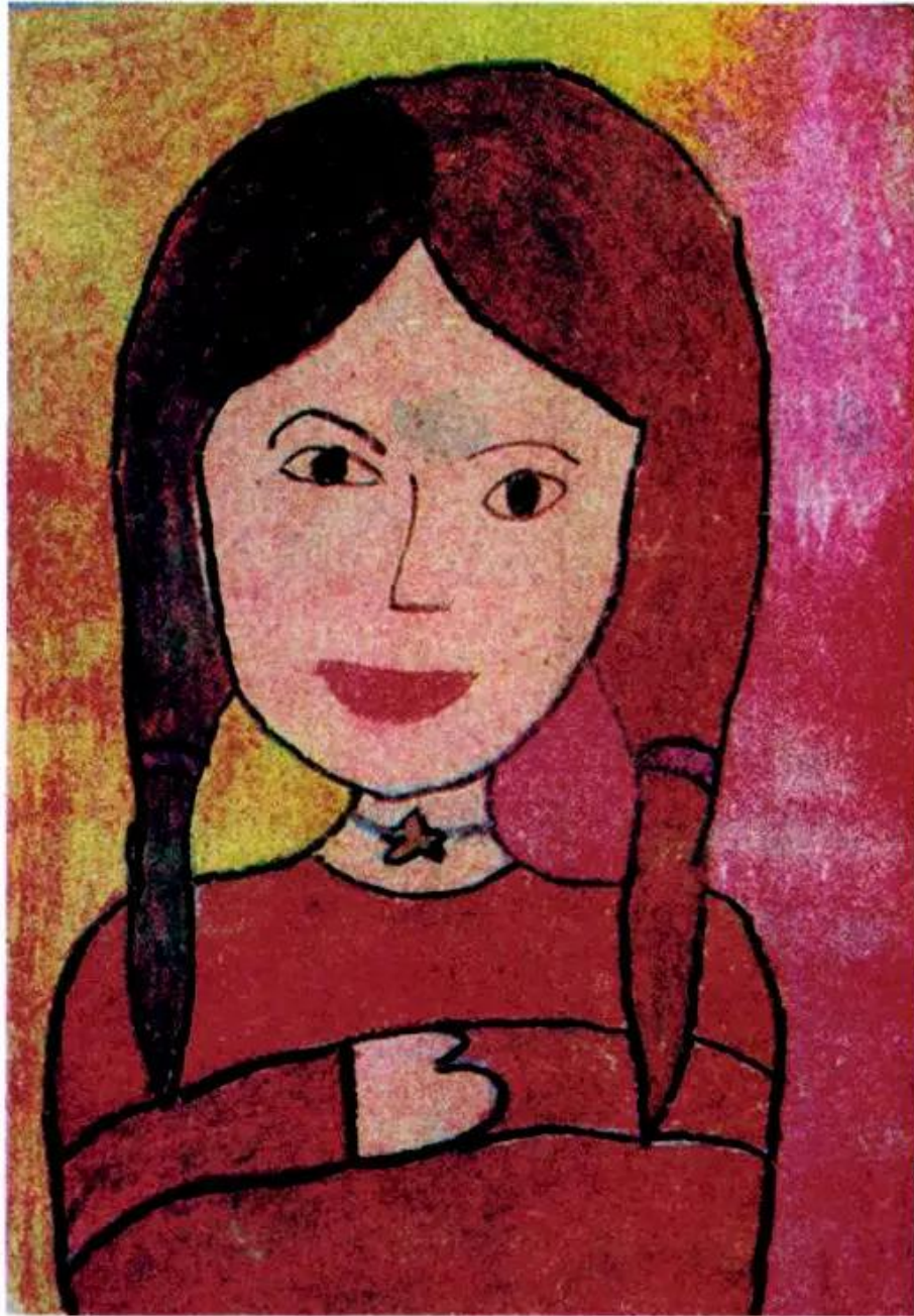
Cô giáo em. Tranh sếp màu của học sinh