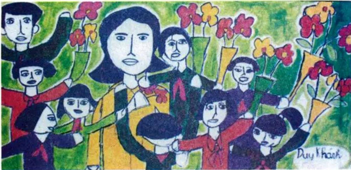
Tặng hoa cô giáo. Tranh màu nước của học sinh