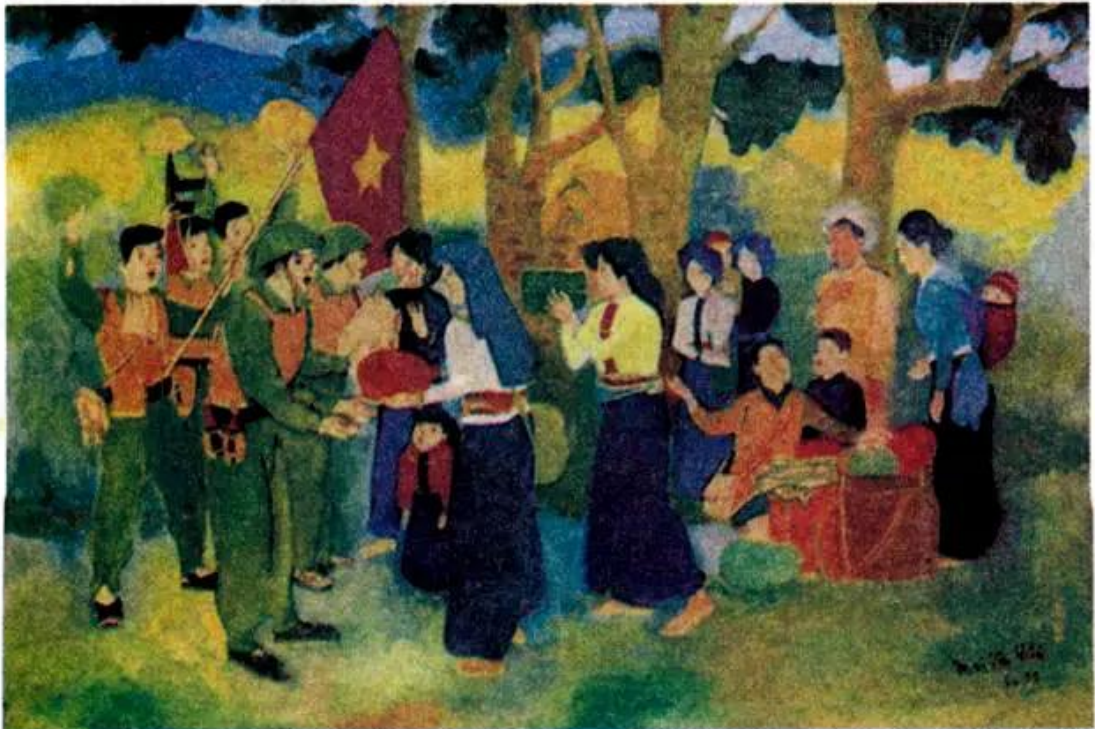
Tình quân dân. Tranh màu bột của hoạ sĩ Mai Văn Hiến