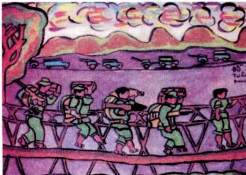
Hành quân qua cầu. Tranh màu nước của học sinh