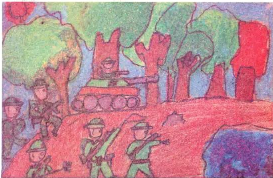
Tập trận. Tranh sếp màu của học sinh