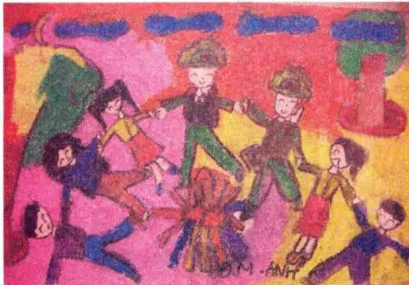
Múa hát cùng các chú bộ đội. Tranh sếp màu của học sinh