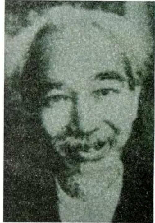
Hoạ sĩ NGUYỄN ĐỖ CUNG (1912 - 1977)

Hoạ sĩ Nguyễn Đỗ Cung sinh năm 1912 tại xã Xuân Tảo, huyện Từ Liêm, Hà Nội. Ông tốt nghiệp Trường Mỹ thuật Đông Dương năm 1934 và tham gia Cách mạng từ rất sớm (1945). Kháng chiến toàn quốc bùng nổ, ông tham gia mở các lớp đào tạo họa sĩ tại Nam Trung Bộ và sáng tác nhiều tranh. Du kích tập bắn là một trong những tác phẩm nổi tiếng của ông ở giai đoạn này. Ông còn có nhiều tác phẩm được đánh giá cao như Công nhân cơ khí ; Tan ca, mời chị em đi họp để thi thợ giỏi ,...