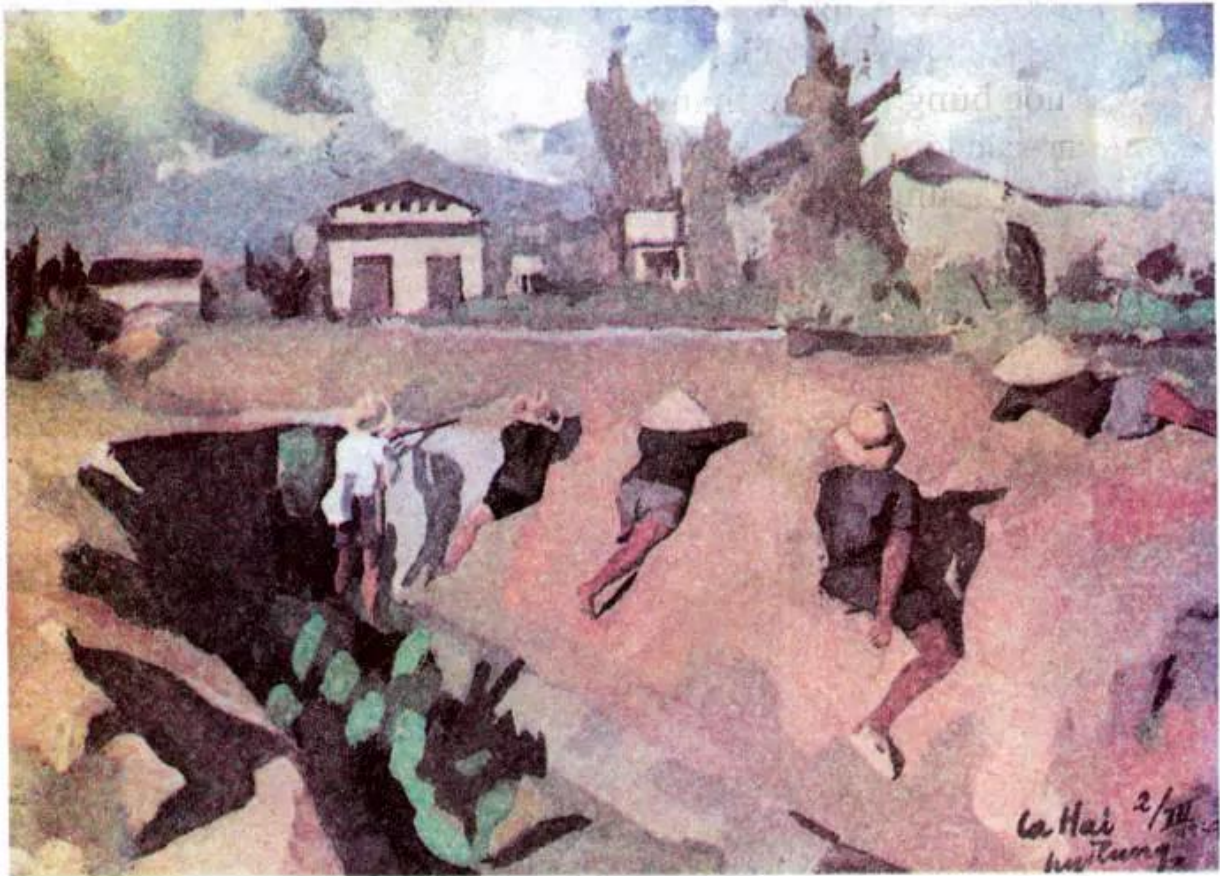
Du kích tập bắn . Tranh màu bột của họa sĩ Nguyễn Đỗ Cung

Bức tranh Du kích tập bắn được sáng tác năm 1947, trong thời kì kháng chiến chống thực dân Pháp xâm lược. Tranh được vẽ bằng chất liệu màu bột, diễn tả đội du kích đang tập luyện vào một buổi trưa hè. Hình ảnh các anh du kích được vẽ với những tư thế khác nhau rất sinh động. Màu sắc trong tranh tươi sáng, đậm nhạt rõ ràng, diễn tả được cái nắng chói chang của ngày hè ở Nam Trung Bộ. Bố cục, màu sắc cùng với cách vẽ phóng khoáng của tác giả khiến người xem có cảm giác như được trực tiếp chứng kiến buổi tập luyện của du kích. Du kích tập bắn là một trong những tác phẩm có giá trị nghệ thuật cao.