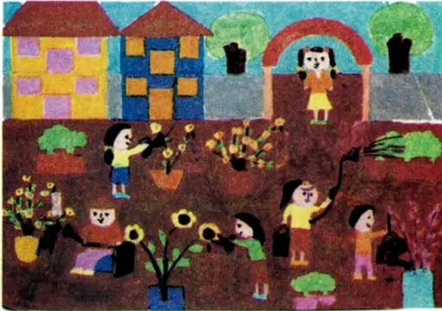
Đón xuân. Tranh màu nước của học sinh