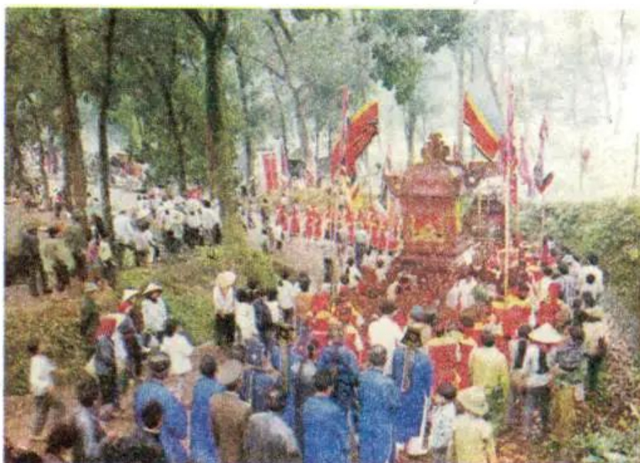
Hội làng (ảnh)

Tết, lễ hội và mùa xuân là những ngày vui trong năm, thường để lại ấn tượng sâu sắc đối với mọi người.