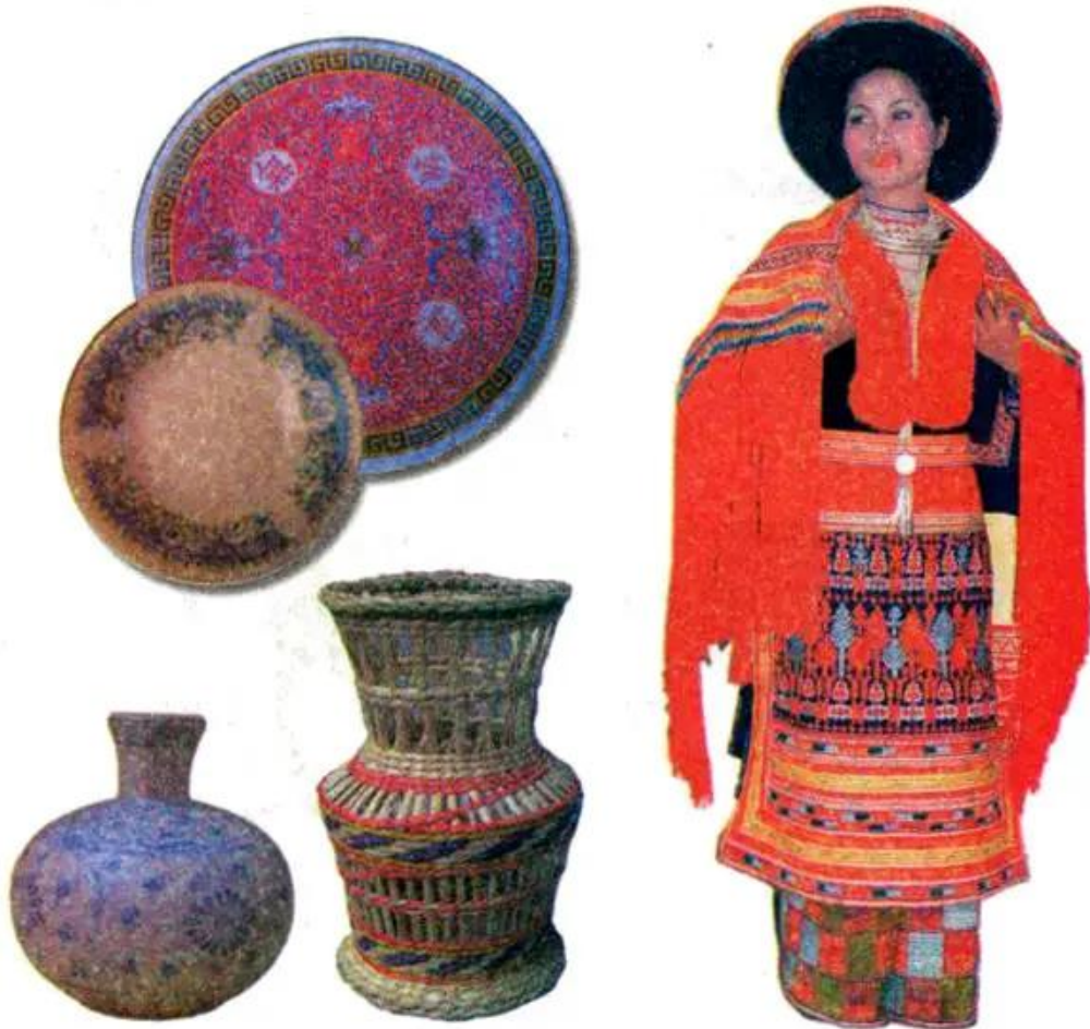
Hình 1. Màu sắc trong trang trí