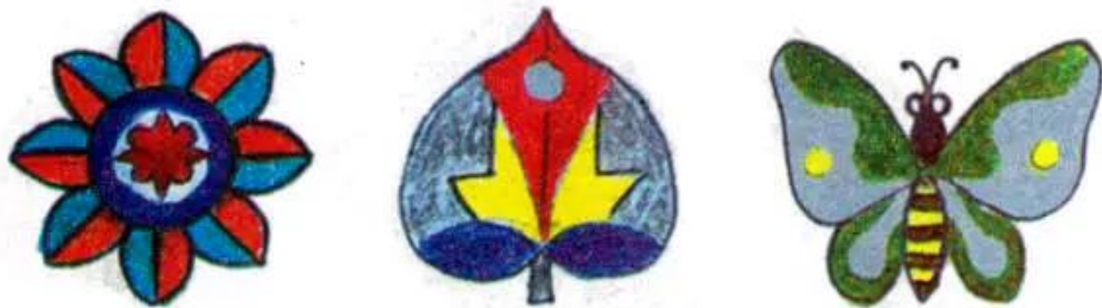
Hình 2. Hoa tiết trang trí