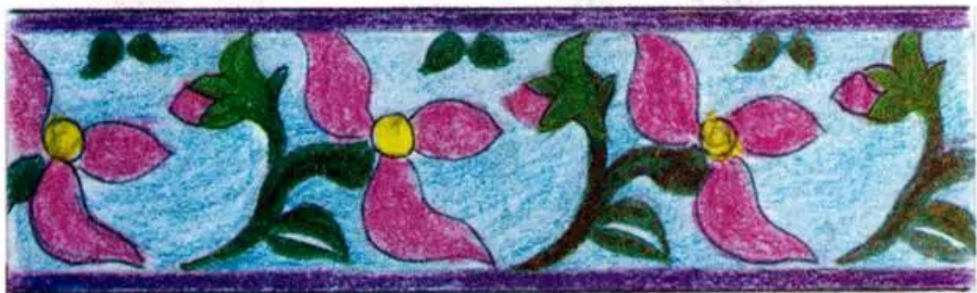
Hình 3. Trang trí đường viền