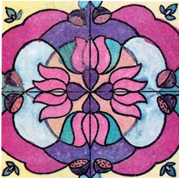
Hình 5. Trang trí hình vuông