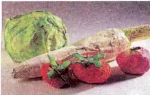
Hình 2. Tạo hình bằng giấy bồi