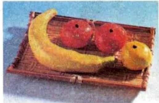
Hình 3. Tạo hình bằng đất màu