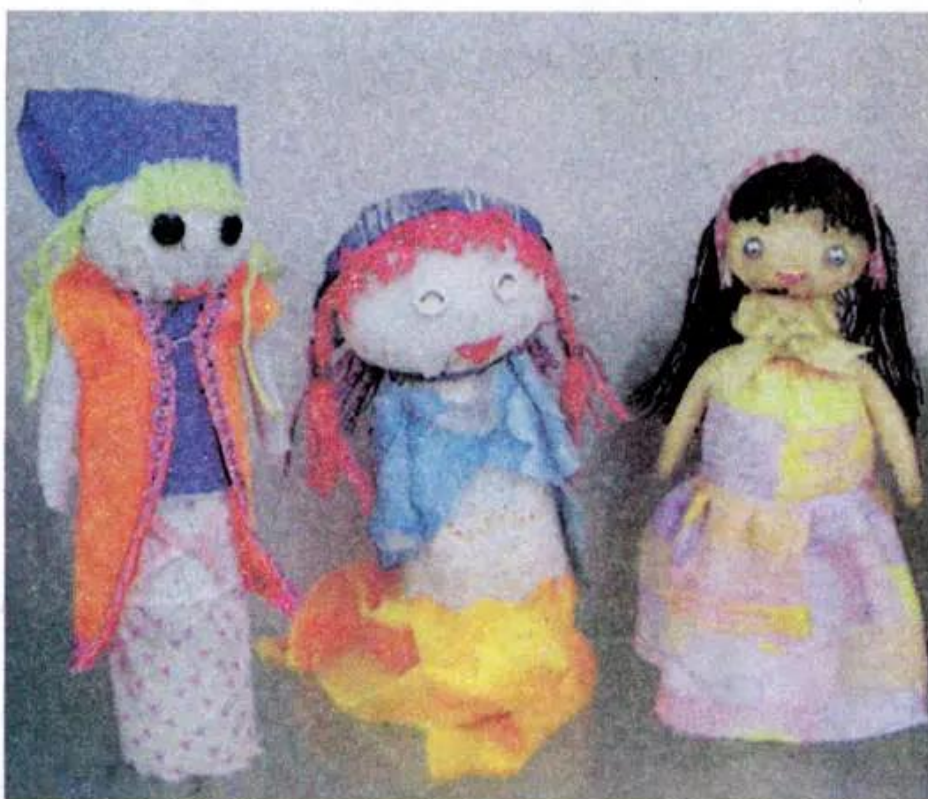
Hình 4. Tạo hình búp bê bằng bông, vải vụn và len