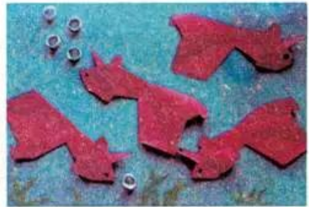
Hình 1. Tạo hình bằng cúc áo, hạt và giấy màu