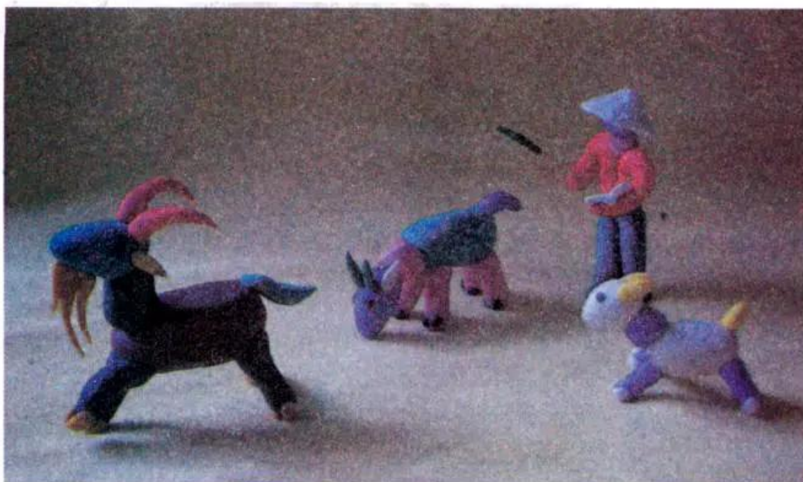
Hình 5. Tạo hình người, con vật bằng đất màu