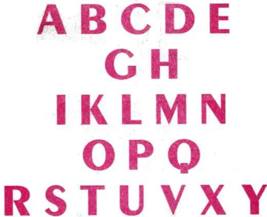
Hình 1. Kiểu chữ in hoa nét thanh nét đậm (kiểu chữ không chân)