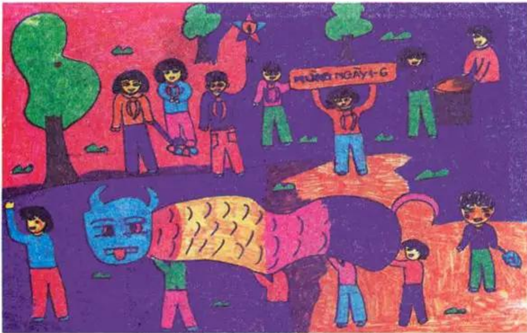
Tết của thiếu nhi. Tranh bút dạ của học sinh