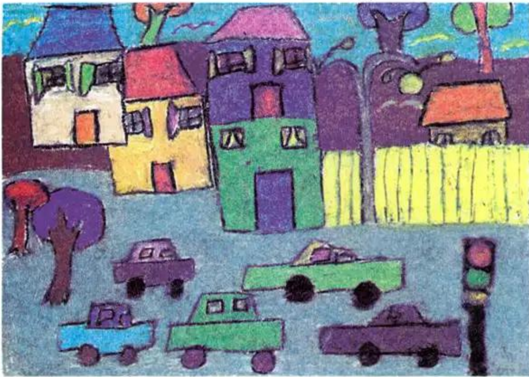
Đường phố sạch đẹp. Tranh sếp màu của học sinh