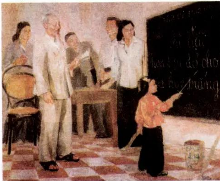
Bác Hồ thăm lớp vỡ lòng. Tranh sơn dầu của họa sĩ Đỗ Hữu Huế