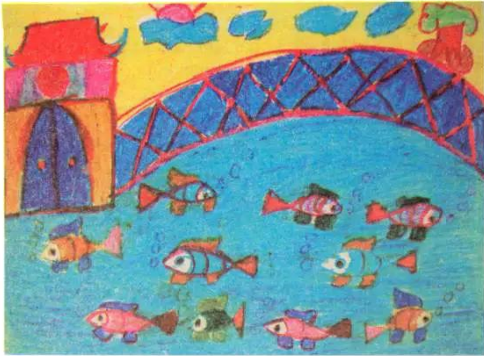
Đàn cá trong hồ nước xanh. Tranh sếp màu của học sinh