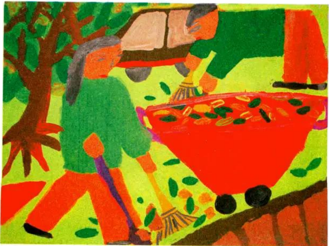
Làm vệ sinh đường phố. Tranh màu bột của học sinh