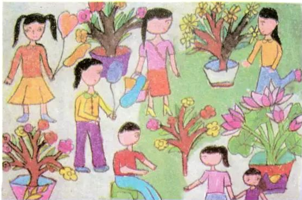
Chúng em dạo chơi trong vườn hoa. Tranh sếp màu của học sinh