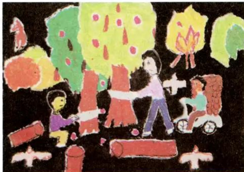
Không được phá rừng. Tranh sếp màu của học sinh