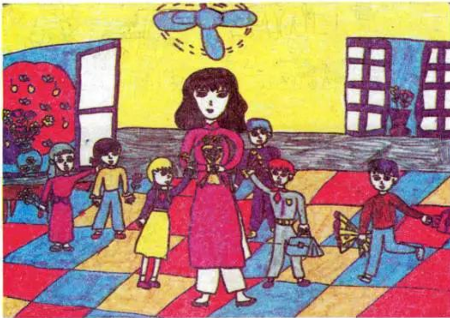
Tặng hoa cô giáo. Tranh bút dạ của học sinh