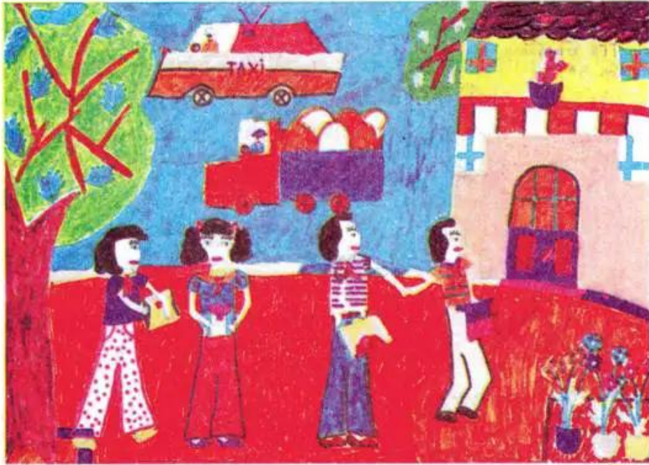
Đến trường. Tranh bút dạ của học sinh