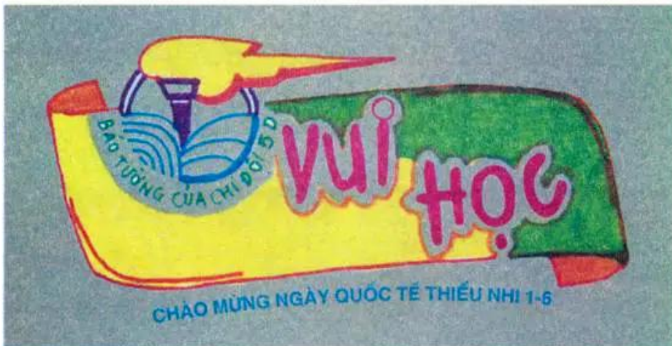
Hình 4. Đầu báo tường chào mừng Ngày Quốc tế Thiếu nhi 1 - 6