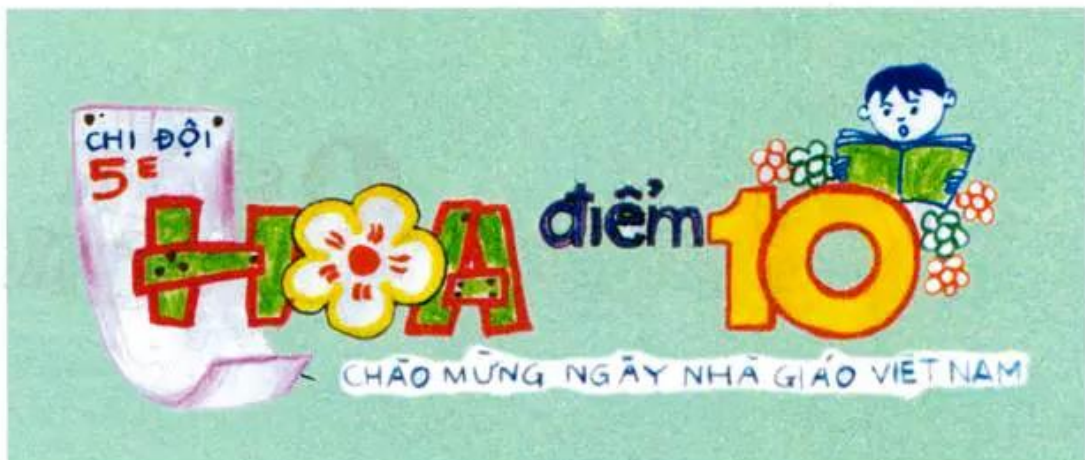
Hình 1. Đầu báo tường chào mừng Ngày Nhà giáo Việt Nam