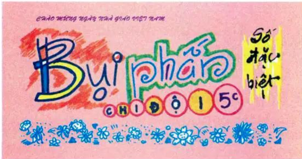
Hình 3. Đầu báo tường chào mừng Ngày Nhà giáo Việt Nam