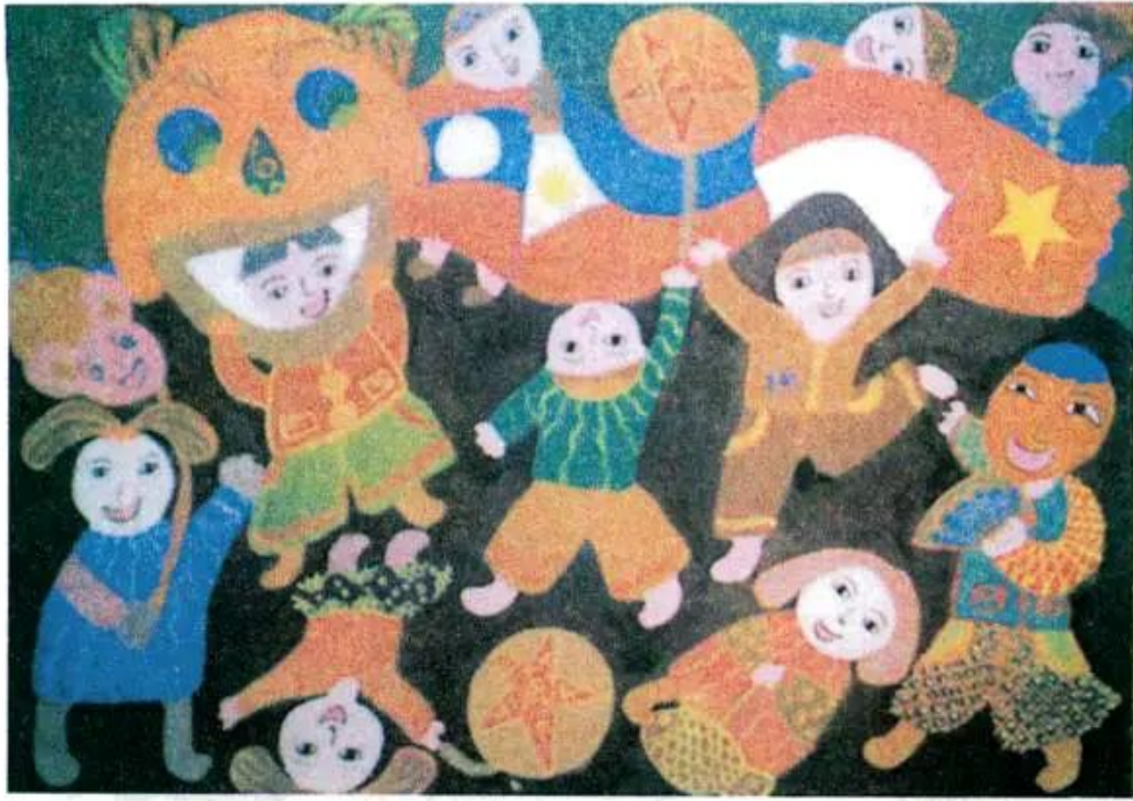
Vui chơi cùng bạn bè. Tranh màu bột của học sinh