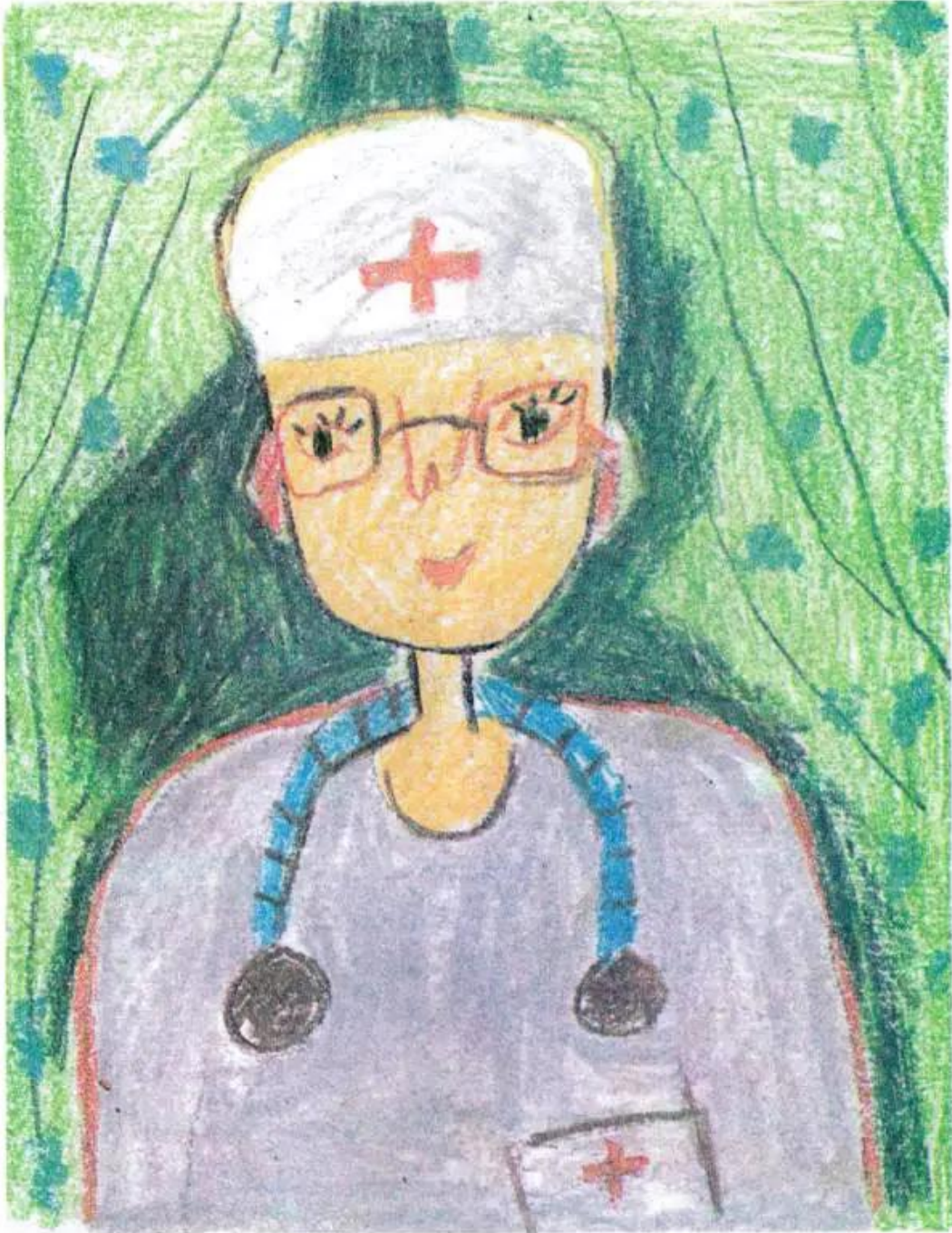
Ước mơ trở thành bác sĩ. Tranh sáp màu của học sinh