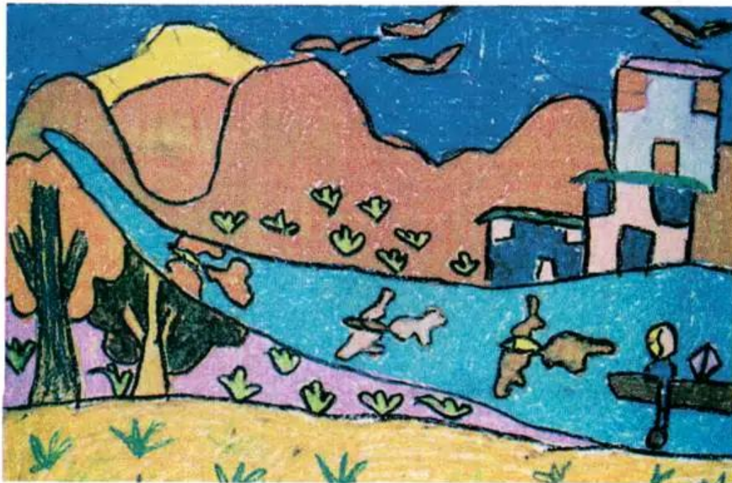
Quê em đổi mới. Tranh sếp màu của học sinh