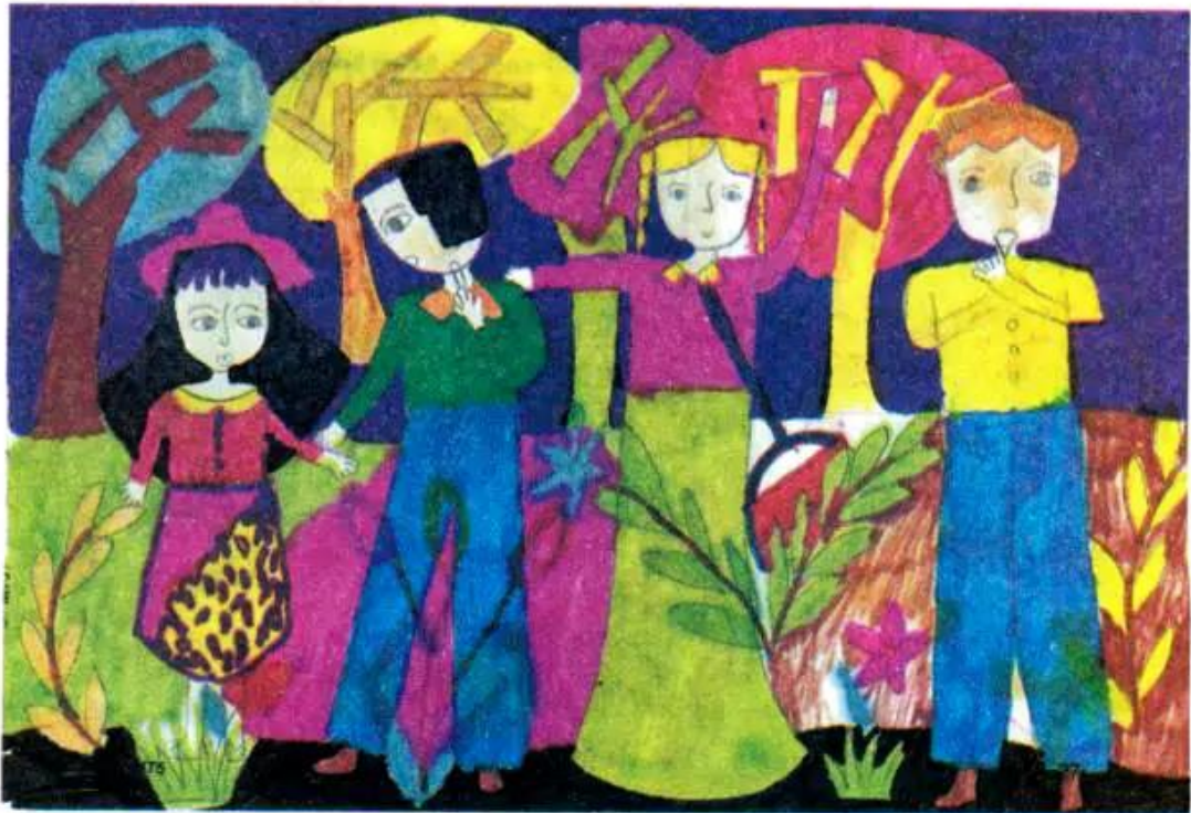
Chúng em mơ ước được vui chơi. Tranh bút dạ của học sinh